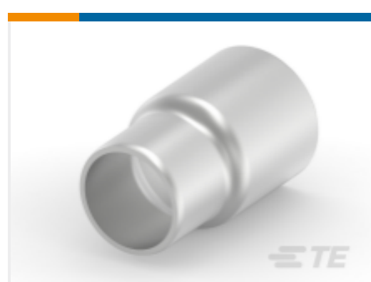
TE 产品编号1587829-1 OUTER FERRULE, SIZE A, HVA280-2PI