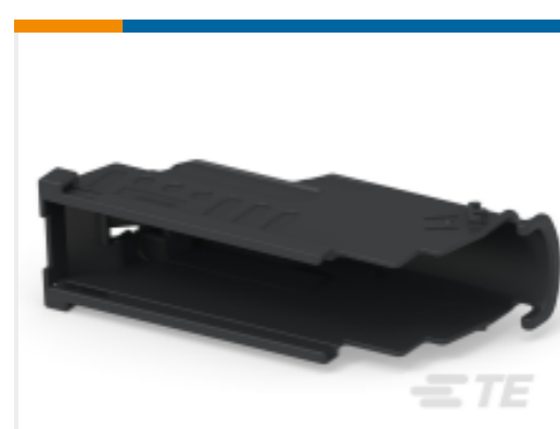
TE 产品编号2069957-1 0.50/1.0 SEALED WIRE COVER 140P TYPE-II