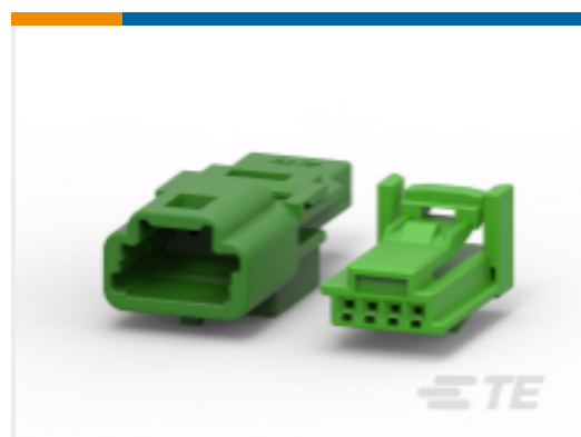
TE 产品编号1717112-2 TH/.025 连接器系统, 壳体