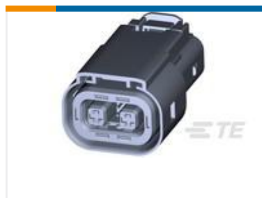
TE 产品编号4-2103177-2 PLUG ASSY, KEY B, FA, CPA, HVA280-2PHI XE