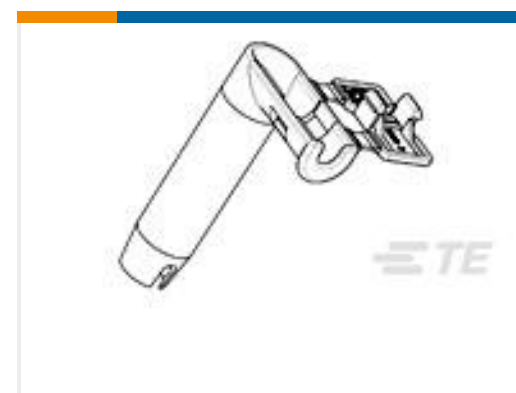
TE 产品编号953318-1 1W HSG FOR DIESEL PLUG