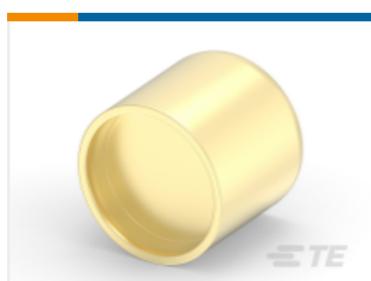
TE 产品编号1587828-1 INNER FERRULE, SIZE A, HVA280-2PI