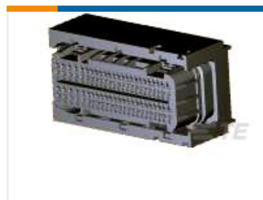
TE 产品编号9-1452380-9 96 POS. CONNECTOR ASSY