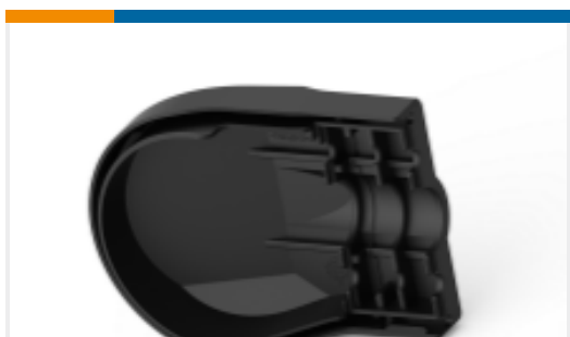
TE 产品编号2177791-1 INSULATION COVER,TE,COVER INLET,BK