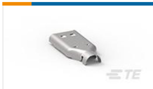
TE 产品编号2103157-1 SHIELD, PLUG, SIZE 1, Sn, HVA280