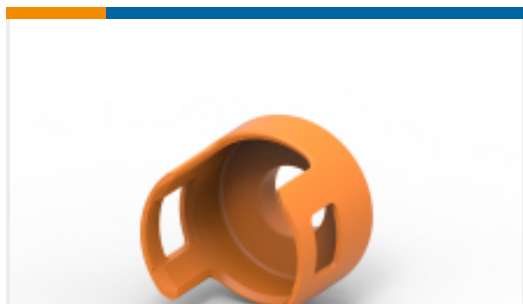
TE 产品编号1-1991225-5 PROTECTIVE COVER. IPT 16-50mm sq. CABLE D