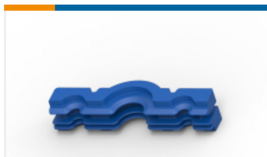
TE 产品编号9-2177861-1 FAMILY SEAL, MIXED, BU, Vers.1