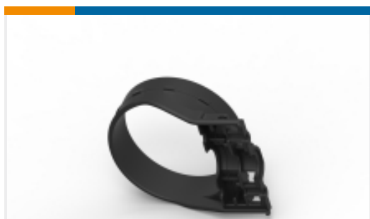
TE 产品编号2177790-1 CABLE FIXATION,TE,COVER INLET