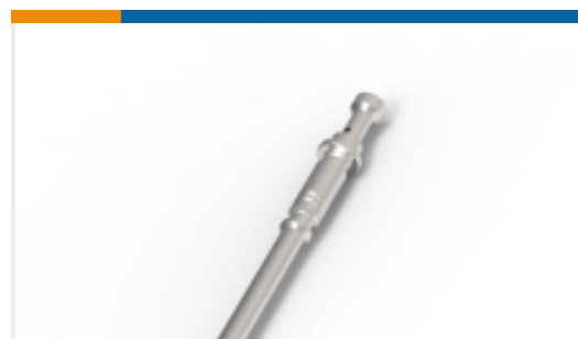
TE 产品编号9-2177814-2 PIN DIA 3.0, PP