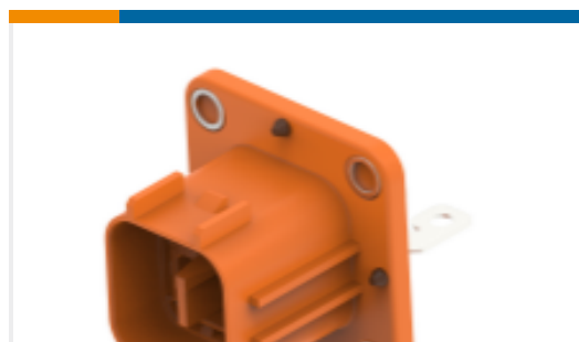
TE 产品编号1-2141272-6 2POS, MIXED,HEADER ASSY,CODF