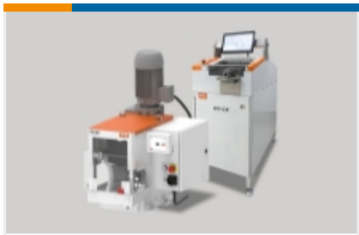
高压线束加工设备(7)