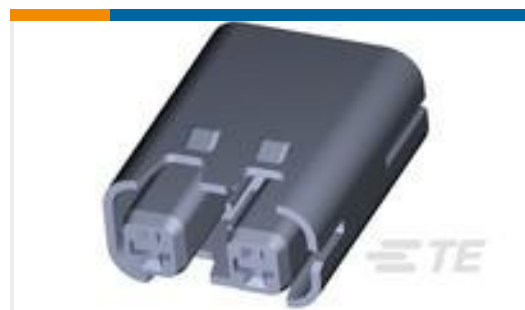
TE 产品编号1587985-1 INNER HSG SUBASSY, HVA280-2PHM