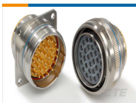
TE 产品编号ZPF000000000007174 983-0RS 08-98 PN