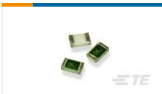
TE 产品编号2-1614884-5 CPF 0805 22R 0.1% 25PPM 1K RL