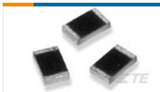
TE 产品编号8-1879257-8 RP 2B 499R 0.1% 15PPM CUT LENGTH