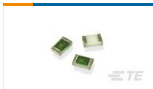
TE 产品编号2-2176090-6 RP 1J 0.166W 237K 0.1% 25PPM 1K RL