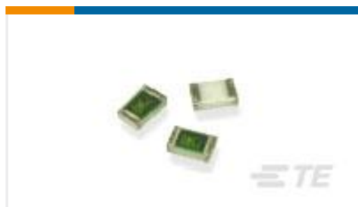
TE 产品编号1676234-2 RN 0805 1K4 0.1% 10PPM 1KRL