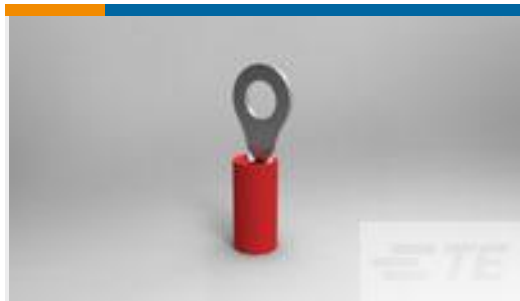
TE 产品编号320551 PIDG R 22-16 COMM 22-18 MIL 8