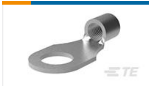
TE 产品编号330301 TERMINAL,SOLIS R 2 10