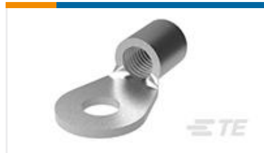
TE 产品编号321598 TERMINAL,SOLIS R 6 1/4