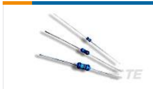
TE 产品编号1622349-1 LR1 1% 1K0