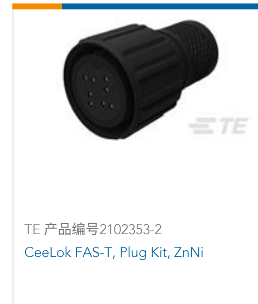
TE 产品编号2102353-2 CeeLok FAS-T, Plug Kit, ZnNi