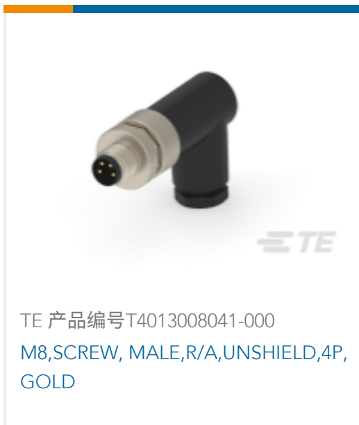
TE 产品编号T4013008041-000 M8,SCREW, MALE,R/A,UNSHIELDED,4P, GOLD