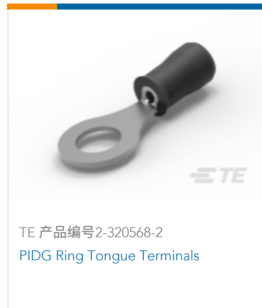
TE 产品编号2-320568-2 PIDG Ring Tongue Terminals