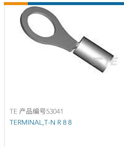
TE 产品编号53041 TERMINAL, T-N R 8 8