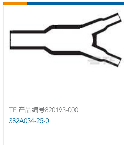
TE 产品编号820193-000 382A034-25-0