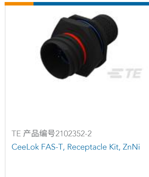
TE 产品编号2102352-2 CeeLok FAS-T, Receptacle Kit, ZnNi