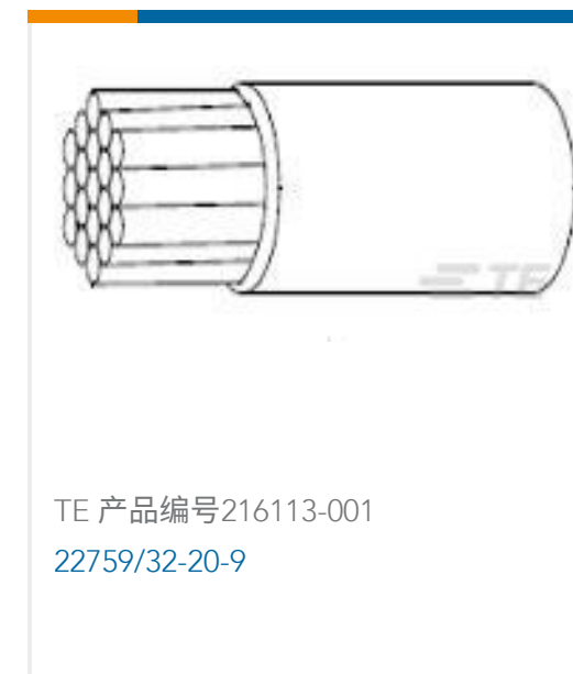
TE 产品编号216113-001 22759/32-20-9