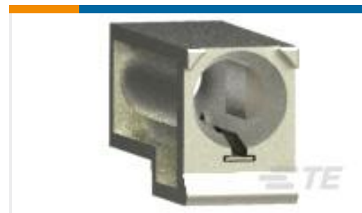
TE 产品编号1-1469492-7 MULTIGIG RT 9MM GUIDE/ESD 270 DEG