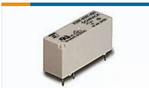
TE 产品编号3-1393222-9 V23061A1007A302=MINISTARKSTROM