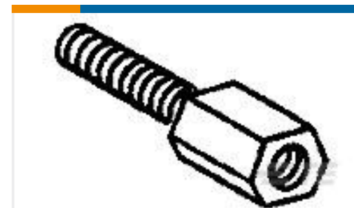
TE 产品编号829261-2 HD.FEMALE SCREWLOCK DEG