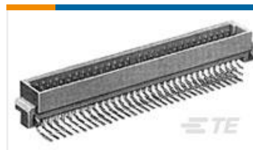
TE 产品编号5650978-5 ASSY,PIN,EURO,TYPE C/2,LEAD-FREE, A&C,32/