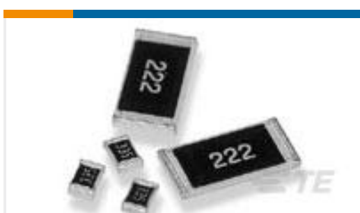
TE 产品编号7-1879533-4 CRGV0603 1% 576K 400V