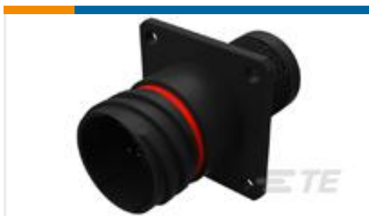
TE 产品编号2102343-2 CeeLok FAS-T, Recpt Kit, Sq, ZnNi