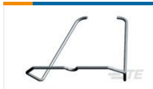
TE 产品编号1393162-1 PT28802