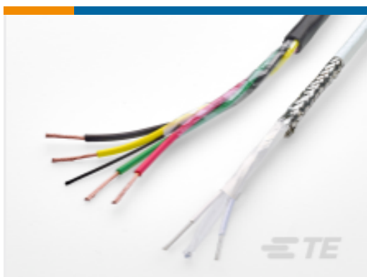
TE 产品编号CB1456-000 1726A1424-9X