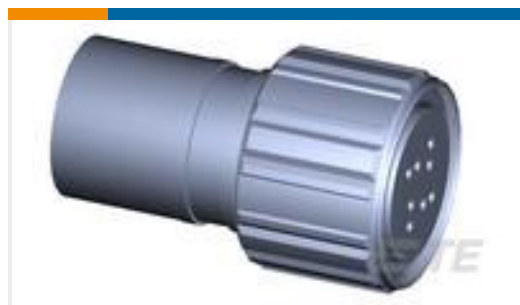
TE 产品编号2102353-4 CeeLok FAS-T, Plug Kit, ZnNi, A