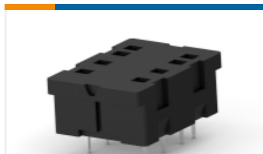
TE 产品编号5-1415043-1 PT78602