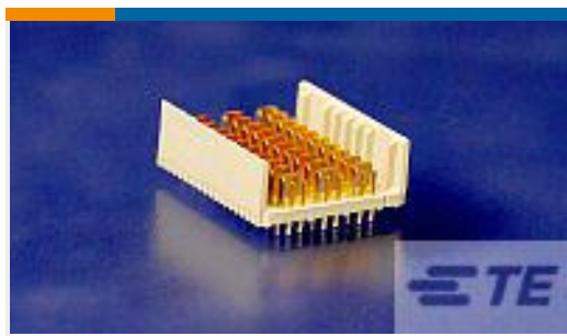
TE 产品编号6469083-1 HMZD 3PAIR, HDR ASSY, 25MM MOD