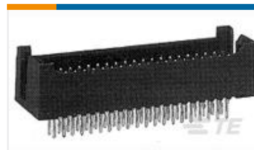
TE 产品编号6-102692-8 72 MODII 2PC HDR DR SHRD, ROHS