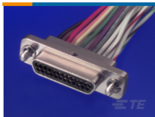
TE 产品编号1-1532181-0 M83513/03-C14N, MCKS-N1-B-21P6G9-72.0