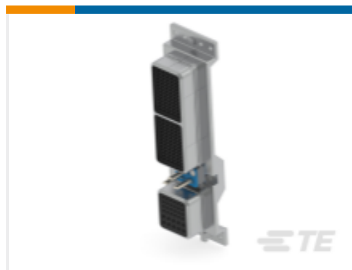
TE 产品编号2157236-1 ARINC PLUG,Sz2,150/150/34,CHRO