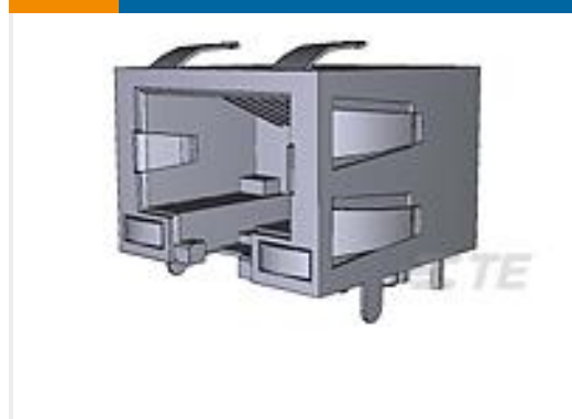
TE 产品编号5-1734324-9 RJ45,8P8C,w/ Y,G LED,W/ panel,dip, 30u"