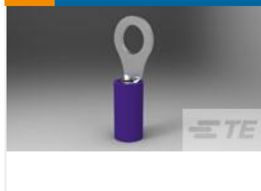
TE 产品编号152892 SIZE 20 PIDG R/T NO.10 NYLON