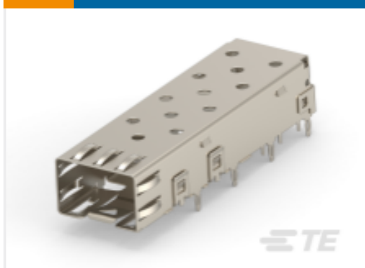
TE 产品编号2227302-3 CAGE ASSY, PRESS FIT, SFP