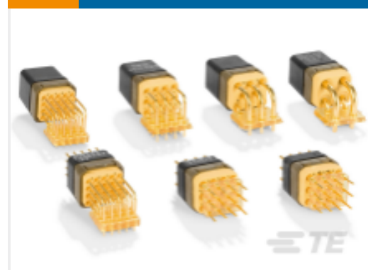
TE 产品编号ZPF00000000163640 732-8301-04 (=33537-SE001)