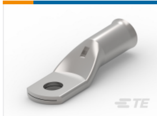
TE 产品编号710030-8 XCT 16-12