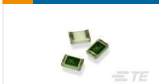
TE 产品编号3-1879213-3 CPF 0402 56R2 0.1% 25PPM 1K RL