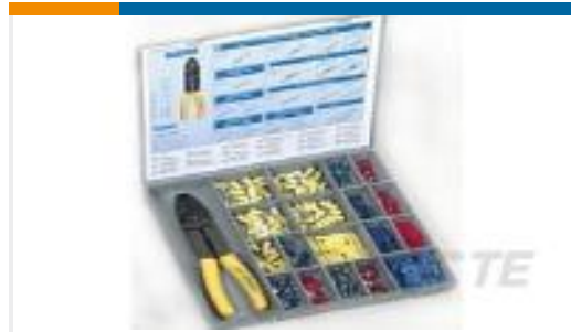
TE 产品编号725929 KFZ REPAIR KIT - LARGE