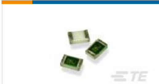
TE 产品编号6-1879213-2 CPF 0402 121R 0.1% 25PPM 1K RL