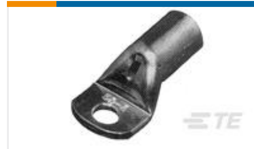
TE 产品编号710026-7 XCT 25-10