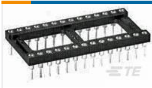
TE 产品编号2-1437539-9 816-AG11D-ESL=SOCKET ASSY