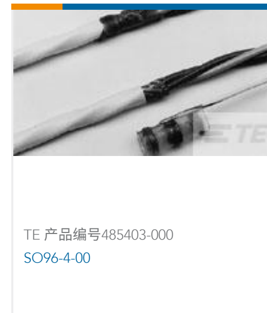
TE 产品编号485403-000 SO96-4-00