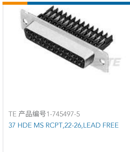
TE 产品编号1-745497-5 37 HDE MS RCPT,22-26,LEAD FREE