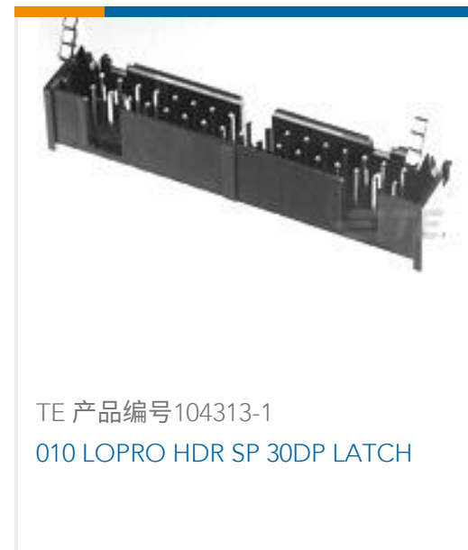
TE 产品编号104313-1 010 LOPRO HDR SP 30DP LATCH