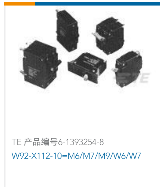
TE 产品编号6-1393254-8 W92-X112-10=M6/M7/M9/W6/W7