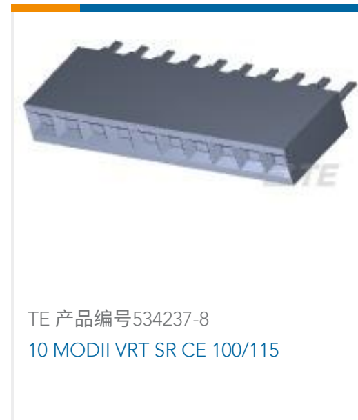
TE 产品编号534237-8 10 MODII VRT SR CE 100/115