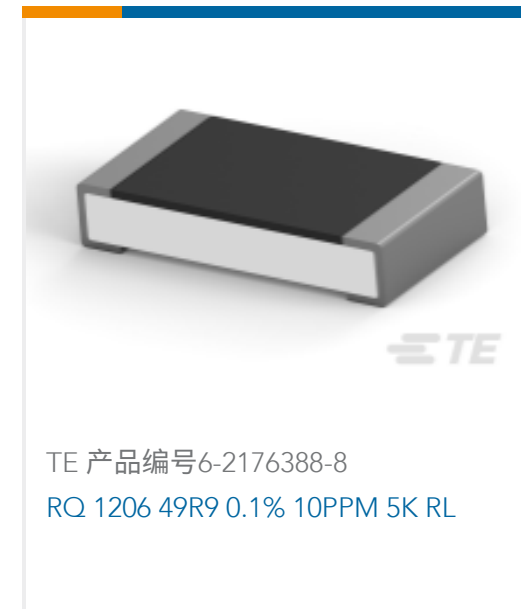
TE 产品编号6-2176388-8 RQ 1206 49R9 0.1% 10PPM 5K RL