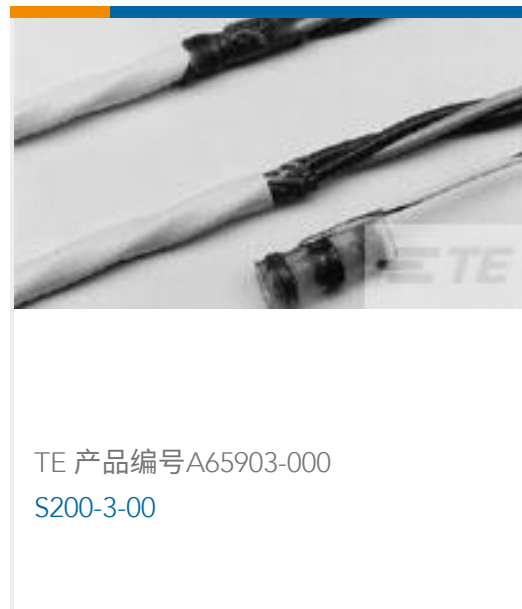
TE 产品编号A65903-000 S200-3-00