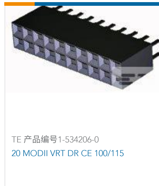
TE 产品编号1-534206-0 20 MODII VRT DR CE 100/115