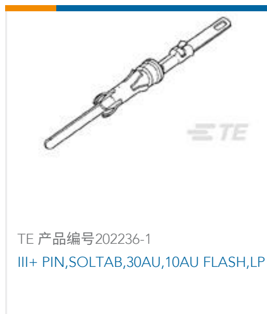
TE 产品编号202236-1 III+ PIN,SOLTAB,30AU,10AU FLASH,LP