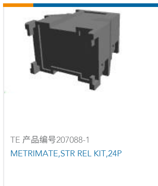
TE 产品编号207088-1 METRIMATE,STR REL KIT,24P