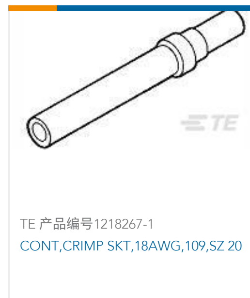
TE 产品编号1218267-1 CONT,CRIMP SKT,18AWG,109,SZ 20