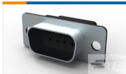
TE 产品编号205204-8 HDP-20, PLUG, SIZE 1, 9 POSN