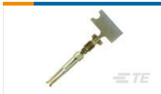
TE 产品编号66505-9 SOCKET CONTACT, 20 DF