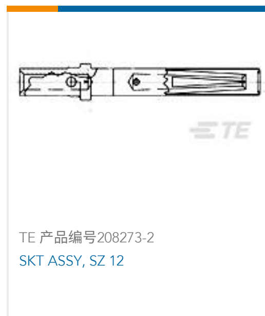
TE 产品编号208273-2 SKT ASSY, SZ 12