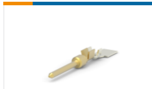
TE 产品编号66507-9 D-Sub 连接器端子：针脚，黄铜，信号，20号