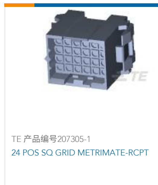
TE 产品编号207305-1 24 POS SQ GRID METRIMATE-RCPT