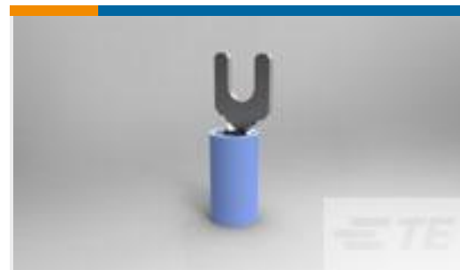
TE 产品编号35559 TERMINAL, PIDG SPD 16-14 6