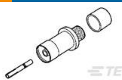
TE 产品编号225831-3 KIT,ARINC COAXICON SOCKET,SZ 1