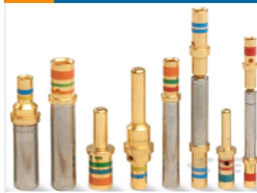
TE 产品编号ZPF000000000000423 006-1169-16