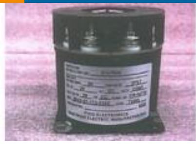
TE 产品编号1616103-2 DH7MN (FAA/PMA)=RELAY