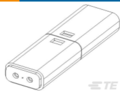
TE 产品编号65053-208 ELEC MODULE