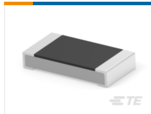
TE 产品编号4-2176392-9 RQ 1206 422K 0.1% 10PPM 5K RL