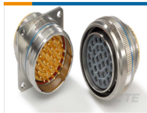
TE 产品编号ZPF000000000007857 983-0YE 12-12 P6