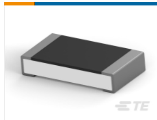
TE 产品编号9-2176388-0 RQ 1206 84R5 0.1% 10PPM 5K RL