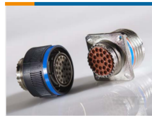
TE 产品编号ZPF000000000090006 DTS 20 K 09-98 PD