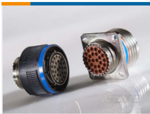
TE 产品编号ZPF000000000017088 DTS 26 K 09-98 SN