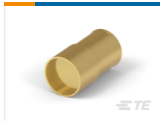
TE 产品编号3-329049-0 FERRULE PLATED