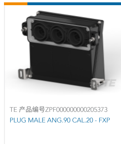
TE 产品编号ZPF000000000205373 PLUG MALE ANG.90 CAL.20 - FXP