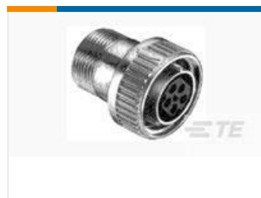
TE 产品编号 208488-4 KITTED CMC PLUG ASSY, 22-16