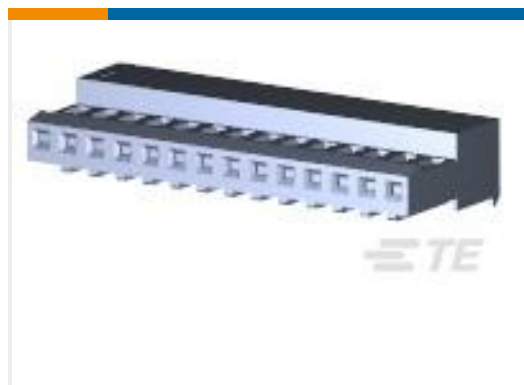
TE 产品编号4-640440-4 14P MTA100 CONN ASSY 22AWG RED