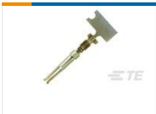
TE 产品编号745253-7 20 DF SOCKET CONT. L.P.