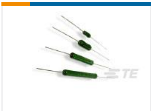
TE 产品编号1-1623774-4 C14 100R 5% (LOOSE)