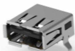
TE 产品编号 1903814-1 INDUSTRIAL USB REC ASSY R/A 1ROW