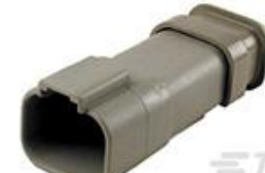
TE 产品编号DT04-4P-E008 REC, 4P, GRY, N, XCAP