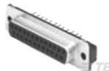
TE 产品编号1-338313-2 9POS.HD-20 REC.ASSY