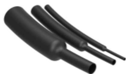
TE 产品编号6472296001 CGPT-R-9.5-0