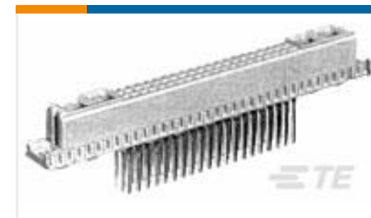
TE 产品编号5148420-5 ASSY,RECPT,TYPE M,EUROCARD,L-F