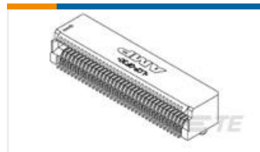
TE 产品编号1367337-2 70 POS PT CONNECTOR, X2, XENPAK, 30 AU