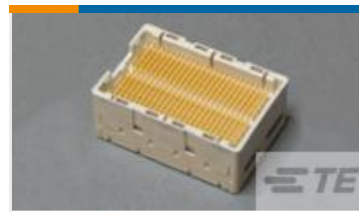
TE 产品编号6-1761614-5 STEP-Z PLUG 15MM 200P LF ST