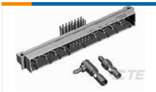
TE 产品编号5148414-5 ASSY,PIN,R.A.,TYPE M,EUROCARD,L-FREE,24+