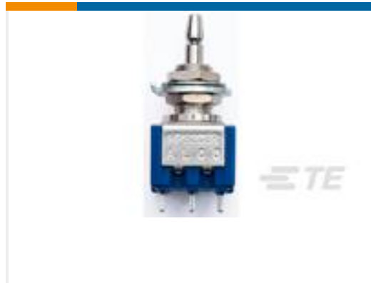
TE 产品编号1977739-2 MPS103F PSHBTTN SPDT MMNTRY