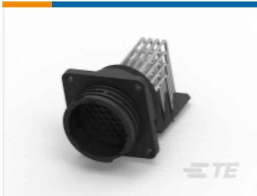
TE 产品编号207825-9 Connectors with Posted Pin Contacts, CPC Series 1