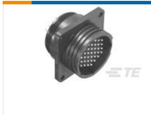
TE 产品编号208223-1 CPC RCPT ASSEMBLY SIZE 13-9