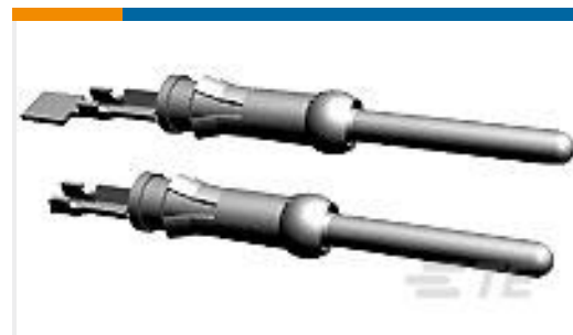
TE 产品编号66597-8 III+ PIN,18-14,TIN ,STRIP