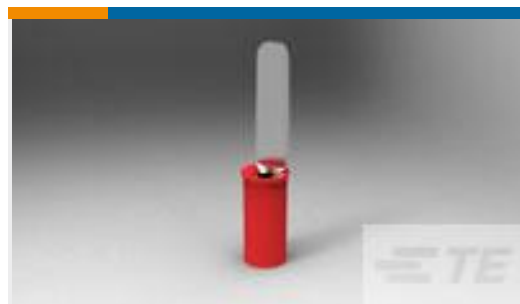
TE 产品编号34294 TAB,PIDG 22-16