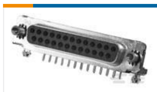
TE 产品编号5745783-2 25 MSFL RCPT RA 318 (FM)