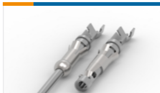
TE 产品编号66602-8 Pin and Socket Contacts, Type III, LP