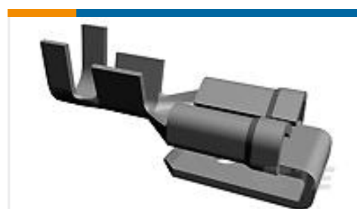
TE 产品编号62026-2 187 FASTON REC 20-16 AWG BR