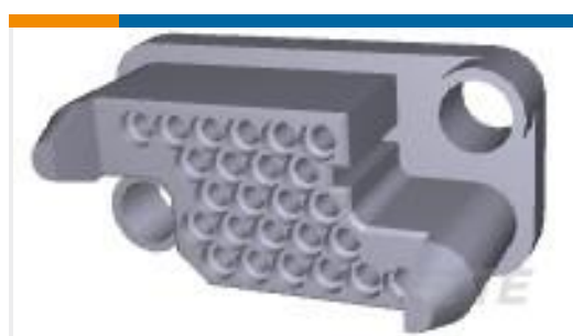
TE 产品编号211150-1 METRIMATE SKT HSG 25P