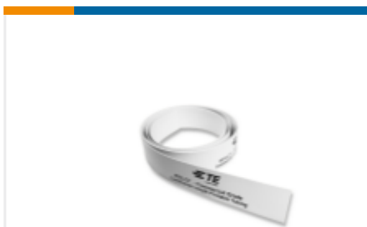
TE 产品编号EL7585-000 RPS-CT-50M-6.4-OUT-9