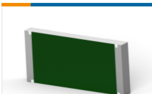
TE 产品编号9-2176404-3 3550 68R 5%