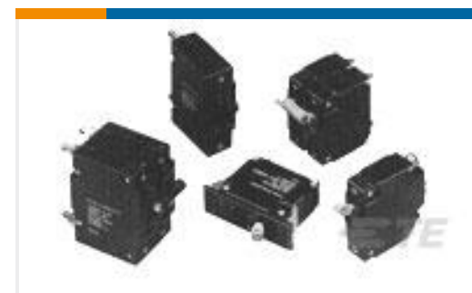
TE 产品编号8-1393252-7 W67-X2Q52-5=M6/M7/M9/W6/W7