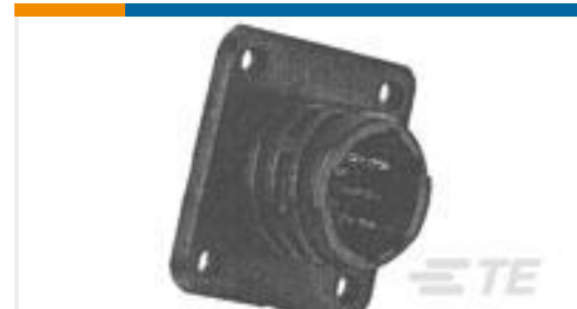
TE 产品编号205841-3 CPC RECPT ASSEMBLY SIZE 11-8