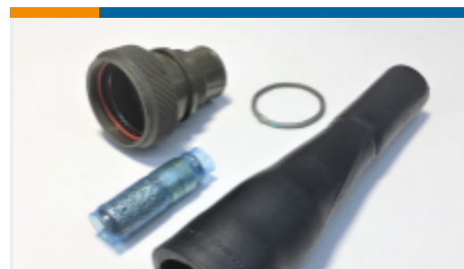
TE 产品编号842723N001 3016-10-340812-CS2359