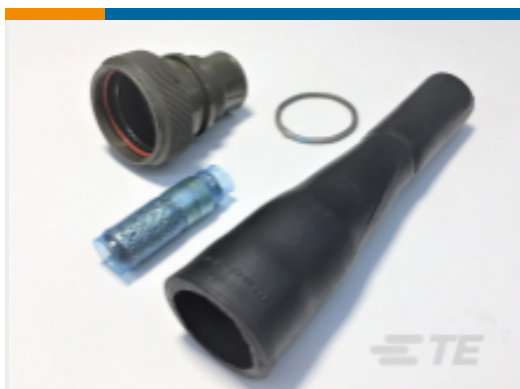
TE 产品编号212545N001 3022-10-441016-CS2359