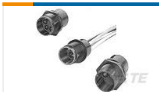
TE 产品编号859527-1 LGH RECEPT., FLANGED, H.V.