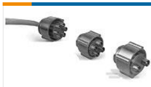
TE 产品编号860267-1 LGH-6 PIN HV PLUG ASY