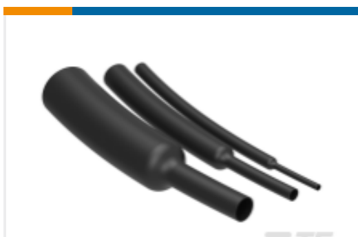
TE 产品编号5069854021 CGPT 2:1 热缩管