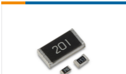
TE 产品编号1-2176327-0 CRGP 0805 56R 1%