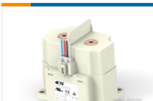
TE 产品编号1-2071568-2 ECP250BHBADA