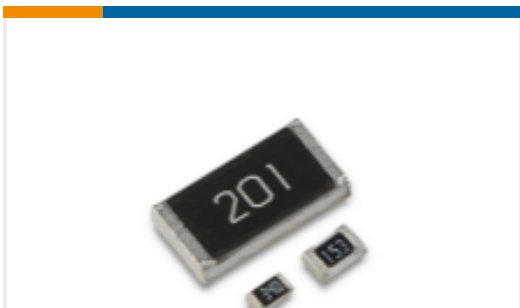
TE 产品编号3-2176327-8 CRGP 0805 12K 1%