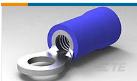
TE 产品编号34158 TERMINAL,PG R 16-14 6