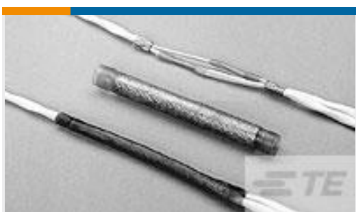
TE 产品编号766146-000 D-150-0170