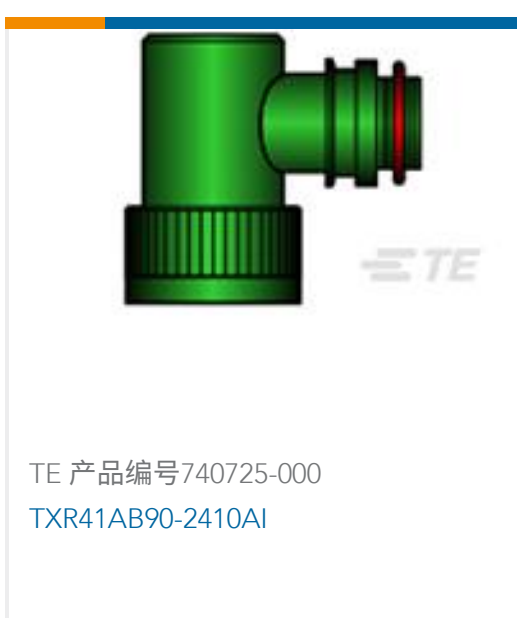
TE 产品编号740725-000 TXR41AB90-2410AI