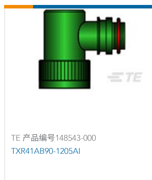
TE 产品编号148543-000 TXR41AB90-1205AI