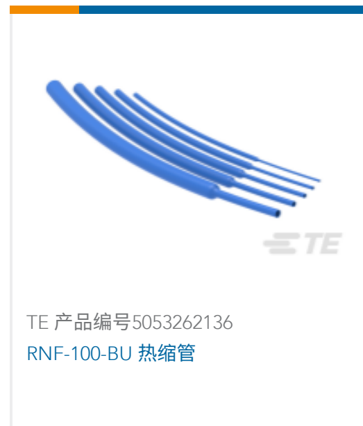
TE 产品编号5053262136 RNF-100-BU 热缩管