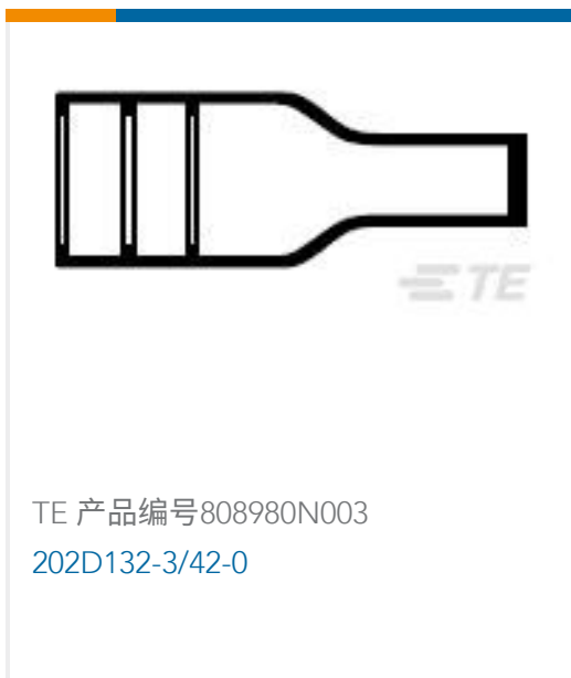
TE 产品编号808980N003 202D132-3/42-0