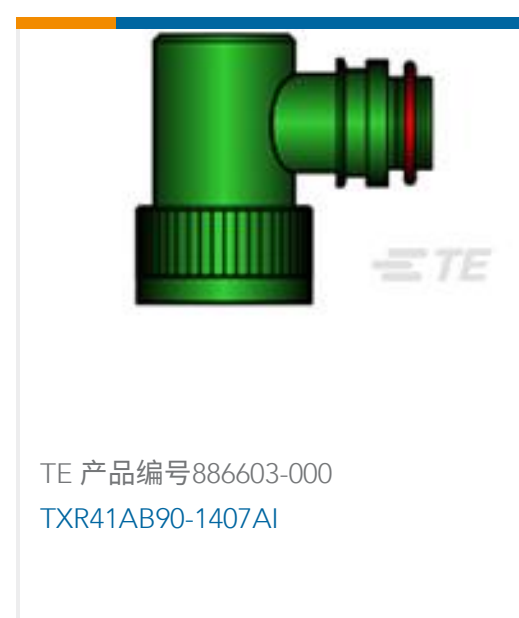
TE 产品编号886603-000 TXR41AB90-1407AI