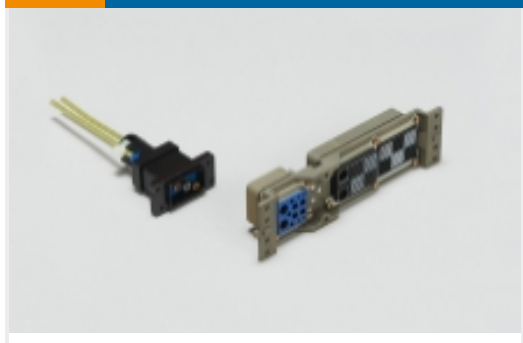
机架和配线架连接器(1)