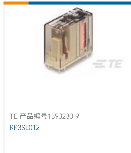
TE 产品编号1393230-9 RP3SL012