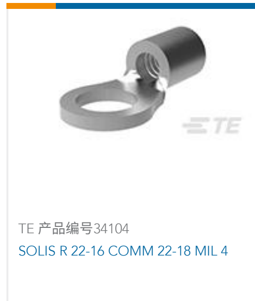
TE 产品编号34104 SOLIS R 22-16 COMM 22-18 MIL 4