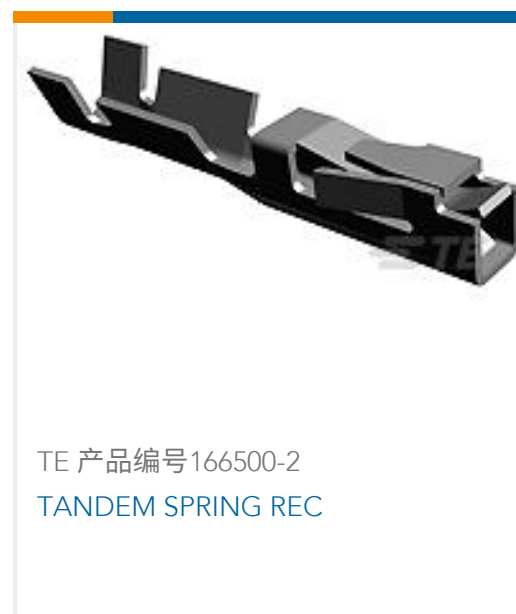
TE 产品编号166500-2 TANDEM SPRING REC