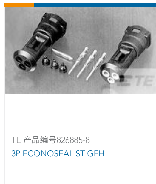
TE 产品编号826885-8 3P ECONOSEAL ST GEH