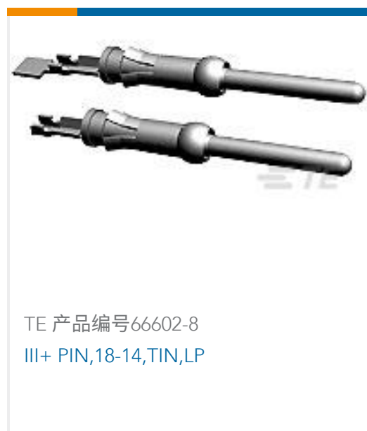
TE 产品编号66602-8 III+ PIN,18-14,TIN,LP