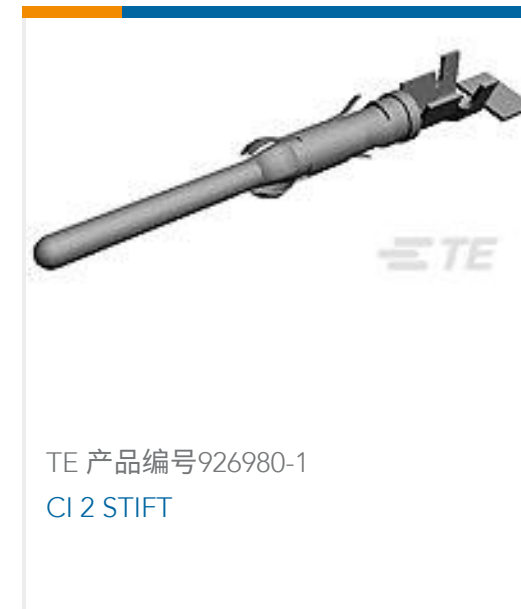
TE 产品编号926980-1 CI 2 STIFT