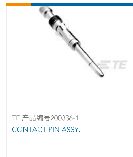
TE 产品编号200336-1 CONTACT PIN ASSY.