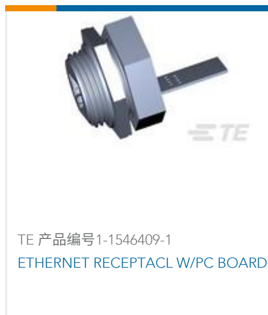
TE 产品编号1-1546409-1 ETHERNET RECEPTACL W/PC BOARD