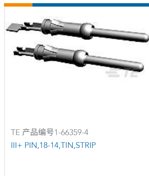
TE 产品编号1-66359-4 III+ PIN,18-14,TIN,STRIP