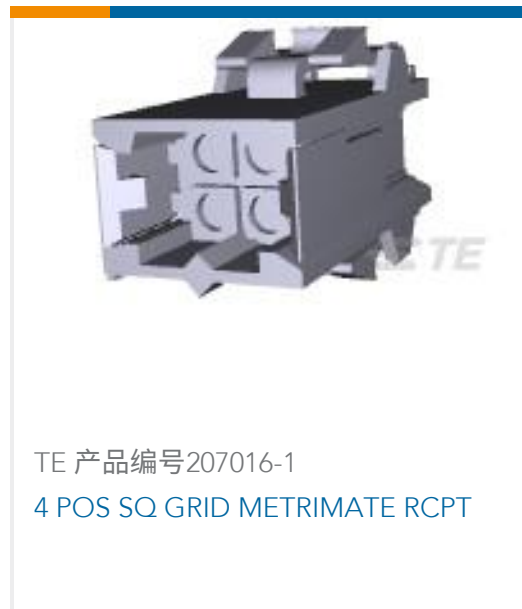
TE 产品编号207016-1 4 POS SQ GRID METRIMATE RCPT