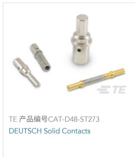
TE 产品编号CAT-D48-ST273 DEUTSCH Solid Contacts