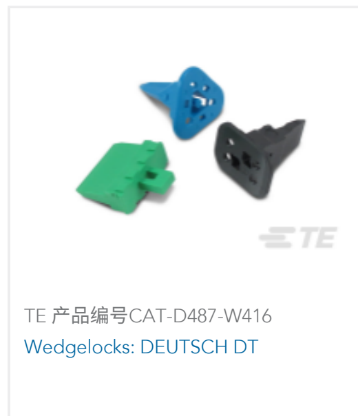
TE 产品编号CAT-D487-W416 Wedglocks: DEUTSCH DT