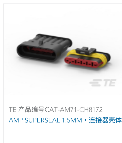
TE 产品编号CAT-AM71-CH8172 AMP SUPERSEAL 1.5MM, 连接器壳体