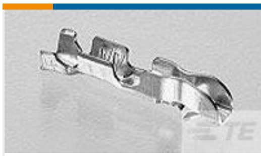
TE 产品编号170262-4 EIS CONNECTOR FORMING