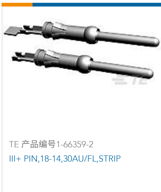
TE 产品编号1-66359-2 III+ PIN,18-14,30AU/FL,STRIP