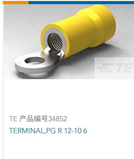
TE 产品编号34852 TERMINAL,PG R 12-10 6