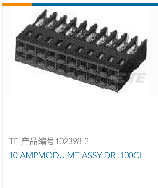
TE 产品编号102398-3 10 AMP MODU MT ASSY DR .100CL