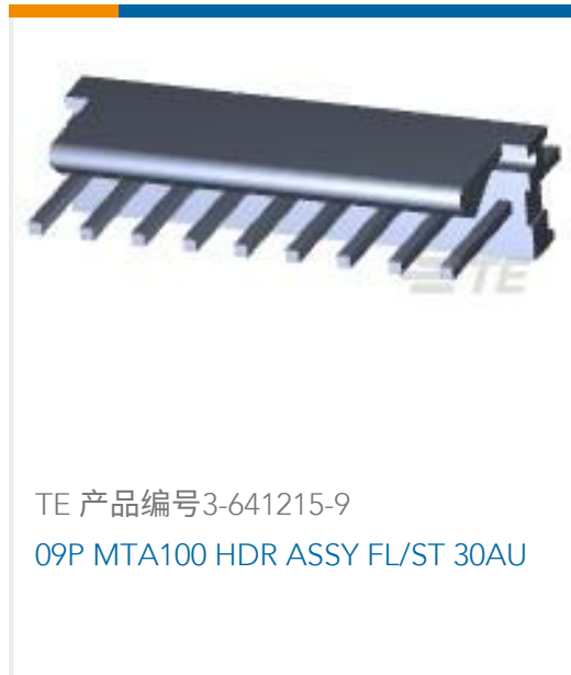
TE 产品编号3-641215-9 09P MTA100 HDR ASSY FL/ST 30AU