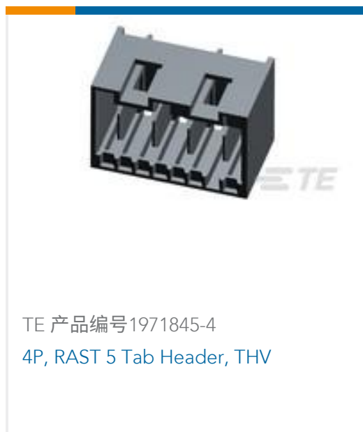
TE 产品编号1971845-4 4P, RAST 5 Tab Header, THV