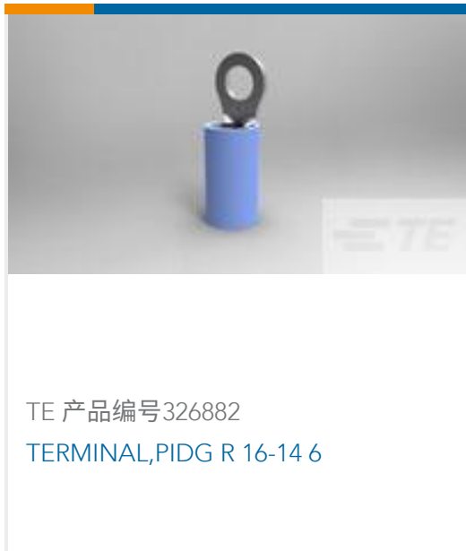
TE 产品编号326882 TERMINAL,PIDG R 16-14 6