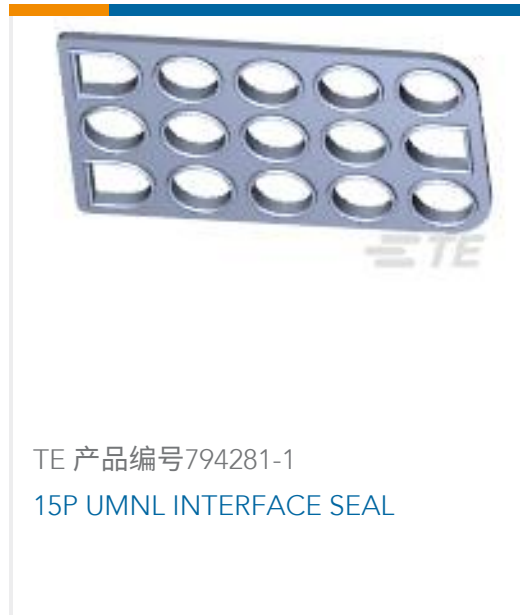
TE 产品编号794281-1 15P UMNL INTERFACE SEAL