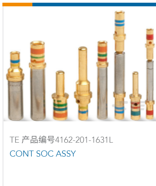
TE 产品编号4162-201-1631L CONT SOC ASSY