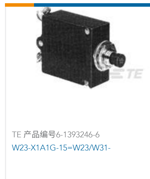
TE 产品编号6-1393246-6 W23-X1A1G-15=W23/W31-