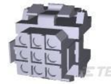
TE 产品编号207439-1 9 POS SQ GRID METRIMATE-PLUG