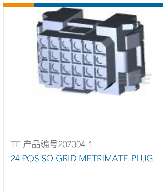
TE 产品编号207304-1 24 POS SQ GRID METRIMATE-PLUG