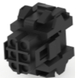
TE 产品编号 207152-1 6 POS SQ GRID METRIMATE-PLUG