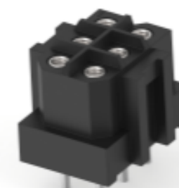
TE 产品编号 1-207524-0 SKT HDR ASSY,6P,MMATE LF