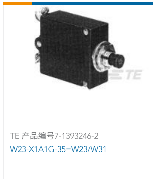
TE 产品编号7-1393246-2 W23-X1A1G-35=W23/W31