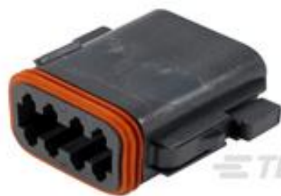
TE 产品编号DT06-08SB PLG, 8P, BLK, N, B