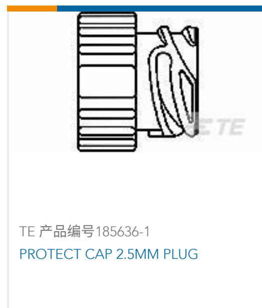
TE 产品编号185636-1 PROTECT CAP 2.5MM PLUG