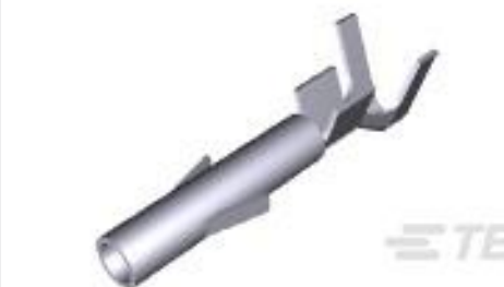
TE 产品编号350551-6 UMNL SOK 20-14 AU/PHBZ L/P