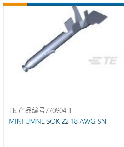
TE 产品编号770904-1 MINI UMNL SOK 22-18 AWG SN