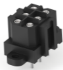
TE 产品编号 207524-7 SKT HDR ASSY,6 POSN,METRIMATE