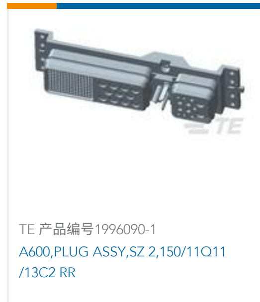
TE 产品编号1996090-1 A600, PLUG ASSY, SZ 2, 150/11Q11 /13C2 RR