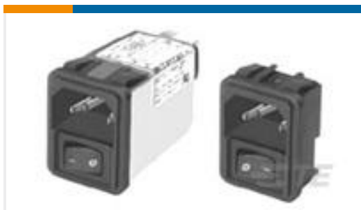
TE 产品编号1609112-3 10CE1 M0=F7804