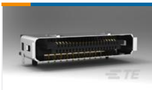
TE 产品编号2129260-2 REC ASSY 0.6mm CHAMP DOCKING C