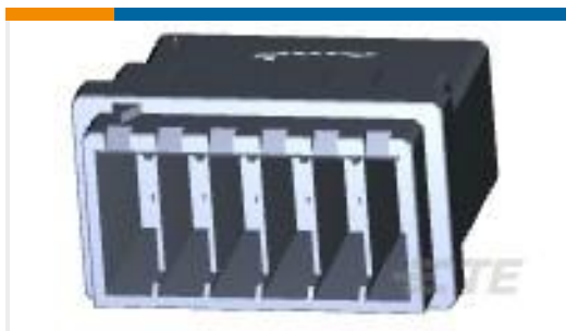
TE 产品编号917242-6 DYNAMIC D-3500 WTW TAB HSG 12P