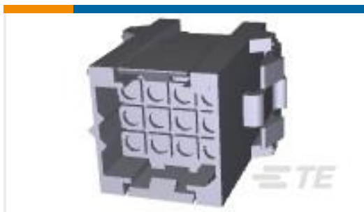
TE 产品编号207018-1 METRIMATE RCPT 12 POS