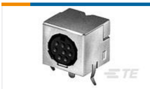
TE 产品编号5749232-1 Mini DIN, 8 pos, R/A, Shield