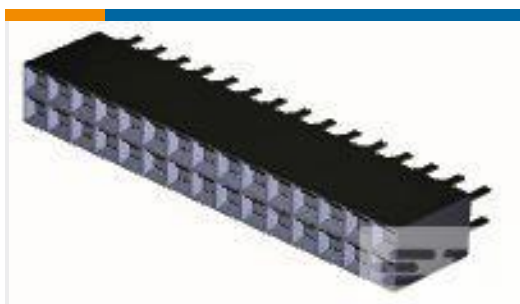
TE 产品编号1-534998-5 30 MODIV VRT DR CE 100/125