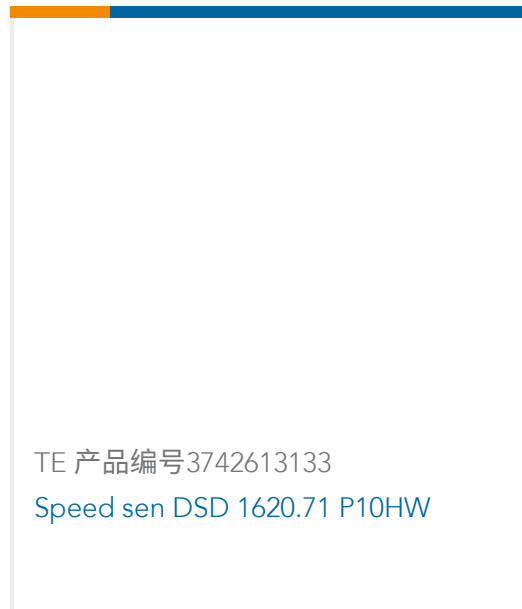
TE 产品编号3742613133 Speed sen DSD 1620.71 P10HW