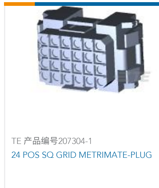
TE 产品编号207304-1 24 POS SQ GRID METRIMATE-PLUG