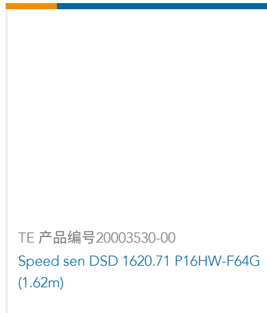
TE 产品编号20003530-00 Speed sen DSD 1620.71 P16HW-F64G (1.62m)