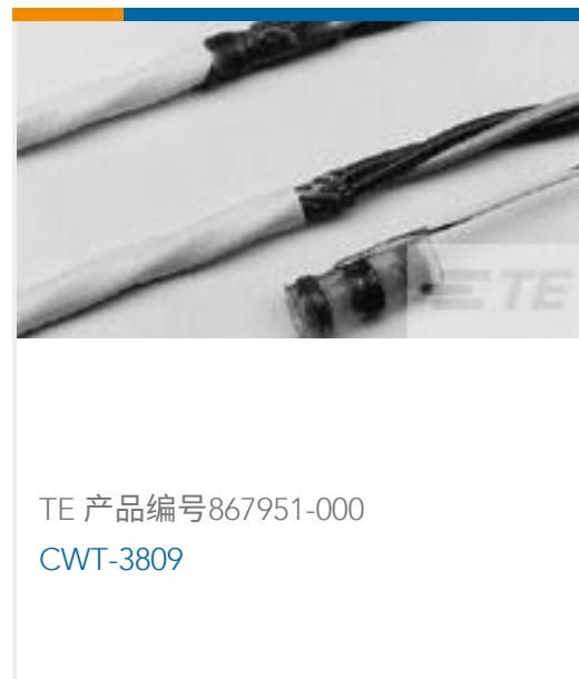
TE 产品编号867951-000 CWT-3809