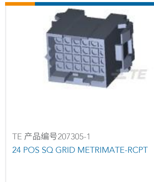
TE 产品编号207305-1 24 POS SQ GRID METRIMATE-RCPT