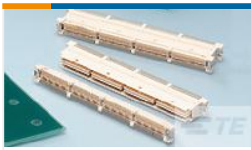
TE 产品编号 2069395-2 V-REC ASSY 160P IEX 0.8MM P H-SP CONN.