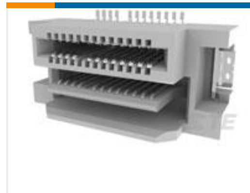
TE 产品编号1565364-2 24P ASSY TYPE F8 Z-STACK CONN.