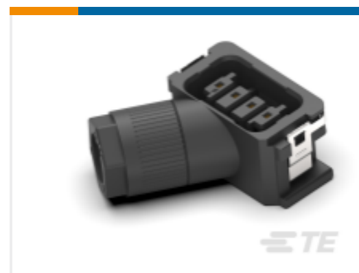
TE 产品编号2314083-2 KIT, REC CONN W CON, RA MMC- PO-P-F90