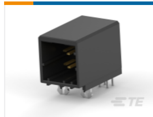
TE 产品编号1-2322866-1 DYNAMIC D2100 HDR H ASSY 8P X SQ