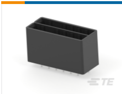
TE 产品编号2-178139-5 Dynamic 3200 HDR 组件