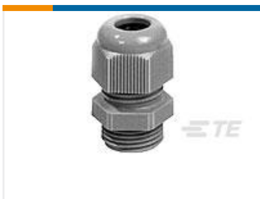
TE 产品编号2-1102771-0 HUT.M20.P