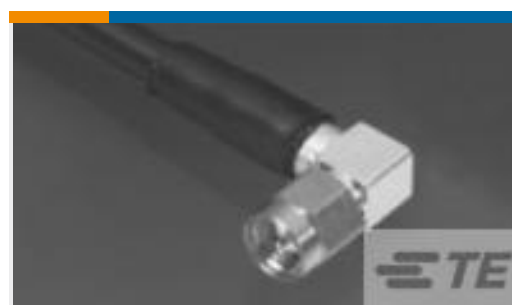
TE 产品编号1052151-1 2037 8007 92