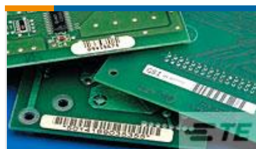
TE 产品编号A63677-000 T2K-254127-10-9