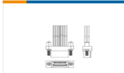
TE 产品编号1-1589474-2 STM025PC2DT048Q = WDUALOBE