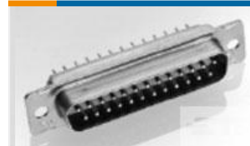
TE 产品编号 207253-1 RECEPT ASSY,9 POSN,AMPLIMITE