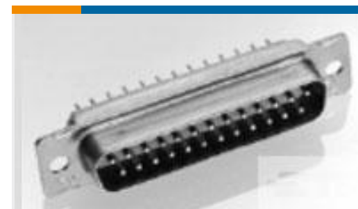
TE 产品编号 206802-2 PLUG ASSY,37 POSN,AMPLIMITE