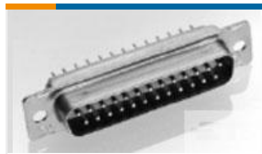
TE 产品编号 206803-2 AMPLIMITE RECEPT ASY,37 POS,