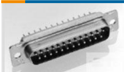
TE 产品编号 206803-1 AMPLIMITE RECEPT ASY,37 POS,