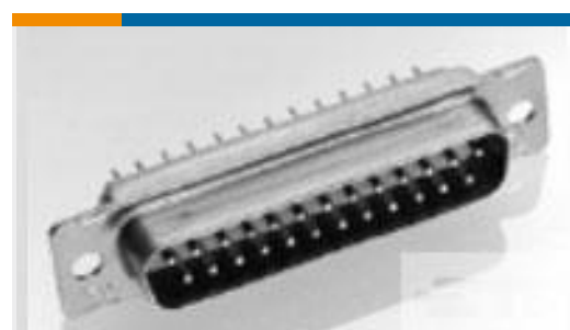
TE 产品编号 448816-5 AMPLIMITE,ASY,RCPT,109,NM,CS,5