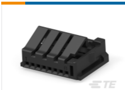
TE 产品编号1-2301969-1 8POS,PICO MQS,REC HSG,UNSLD