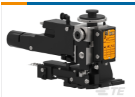
TE 产品编号2836049-2 OC-AT-S-FA-080F110F-120-0325