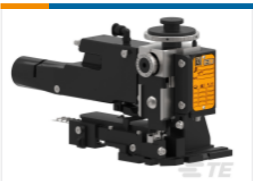
TE 产品编号2266506-2 OCEAN_2.0_Applicator-S-055F067O