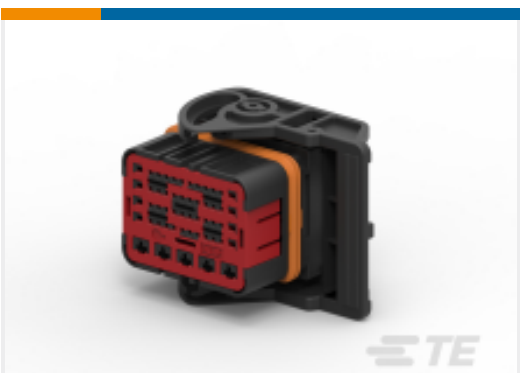
TE 产品编号6-2208775-4 53POS, MIXED,REC HSG,ASSY, SEALED