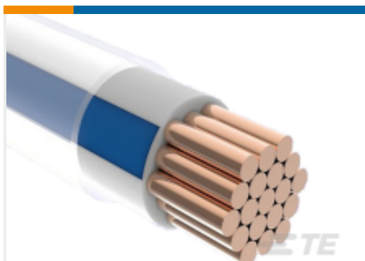
TE 产品编号CQ43013001 ACW0219-2.50-13(NS)