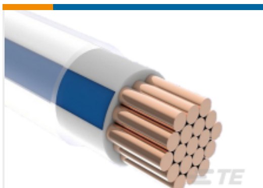
TE 产品编号CD21143001 ACW0219-2.50-12L(NS)