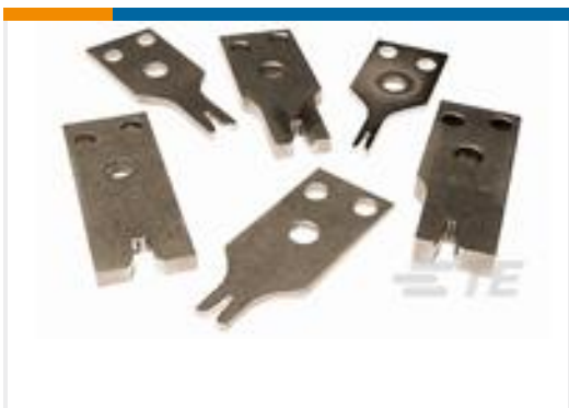
TE 产品编号2-1633966-4 CRIMPER,INSULATION O