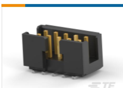
TE 产品编号1-2373376-0 10P,2MM,SHRD HDR,DRVVT,SMD,0.1 AU,TB