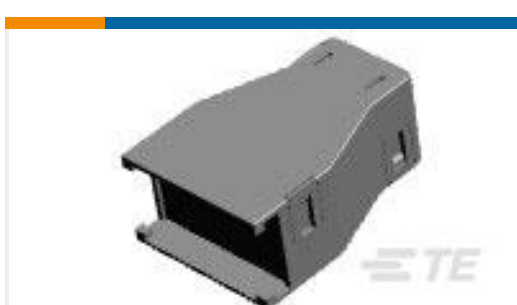
TE 产品编号1986185-1 Strain Relief,6 Posn,D5200 Dynamic. 2