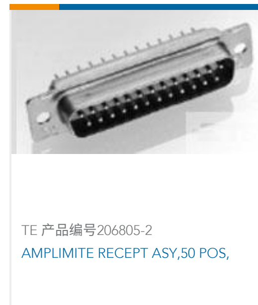
TE 产品编号206805-2 AMPLIMITE RECEPT ASSY, 50 POS,