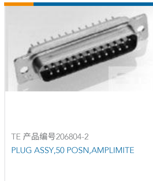
TE 产品编号206804-2 PLUG ASSY, 50 POSN, AMPLIMITE