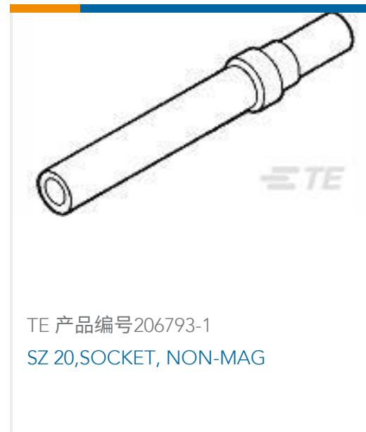
TE 产品编号206793-1 SZ 20, SOCKET, NON-MAG