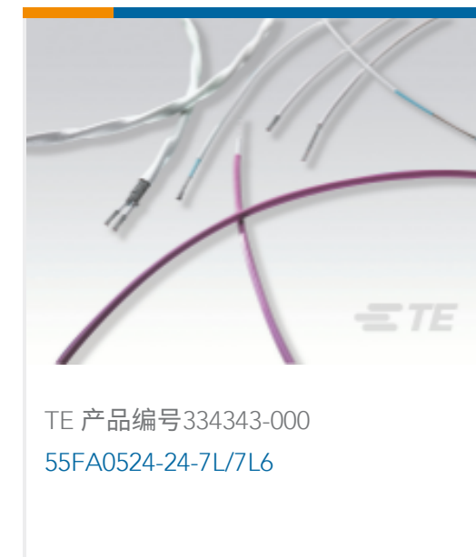
TE 产品编号334343-000 55FA0524-24-7L/7L6