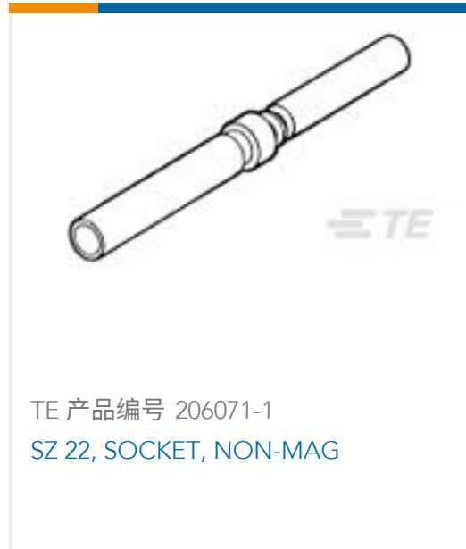
TE 产品编号 206071-1 SZ 22, SOCKET, NON-MAG