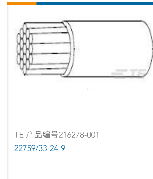
TE 产品编号216278-001 22759/33-24-9