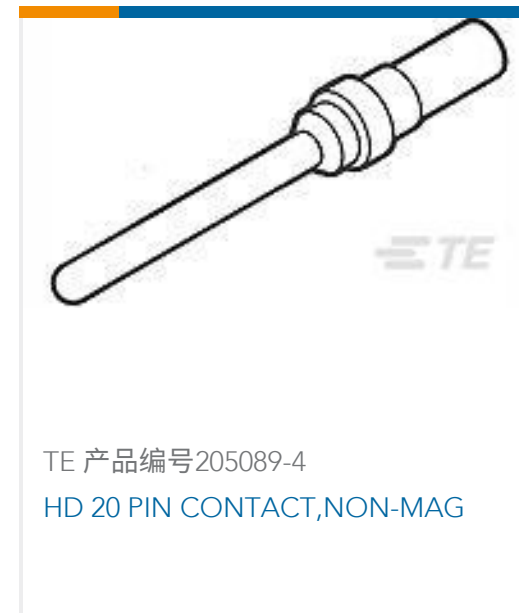
TE 产品编号205089-4 HD 20 PIN CONTACT, NON-MAG