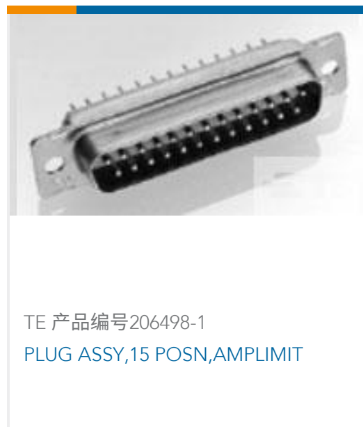
TE 产品编号206498-1 PLUG ASSY, 15 POSN, AMPLIMIT