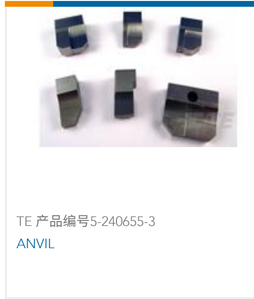
TE 产品编号5-240655-3 ANVIL