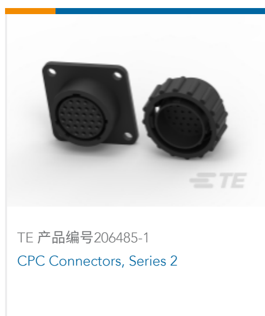
TE 产品编号206485-1 CPC Connectors, Series 2