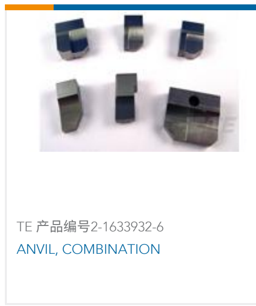
TE 产品编号2-1633932-6 ANVIL, COMBINATION