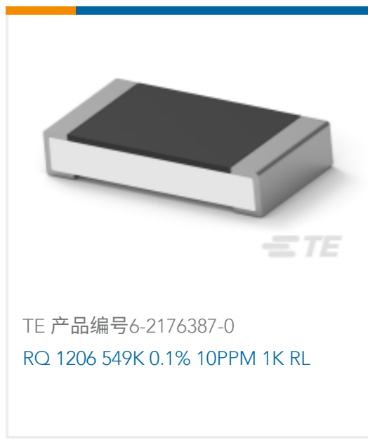
TE 产品编号6-2176387-0 RQ 1206 549K 0.1% 10PPM 1K RL