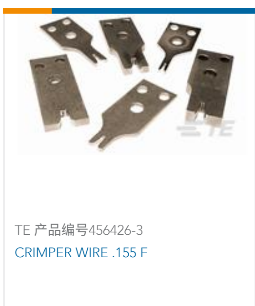
TE 产品编号456426-3 CRIMPER WIRE .155 F