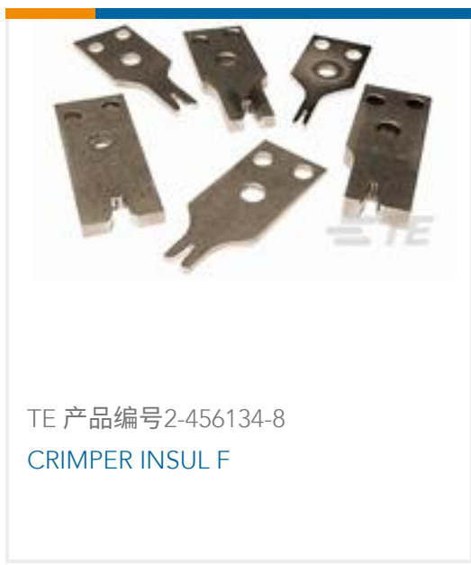
TE 产品编号2-456134-8 CRIMPER INSUL F