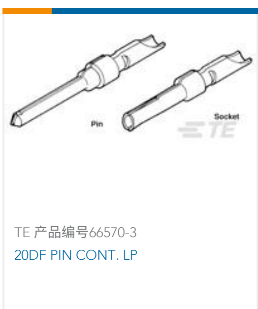
TE 产品编号66570-3 20DF PIN CONT. LP