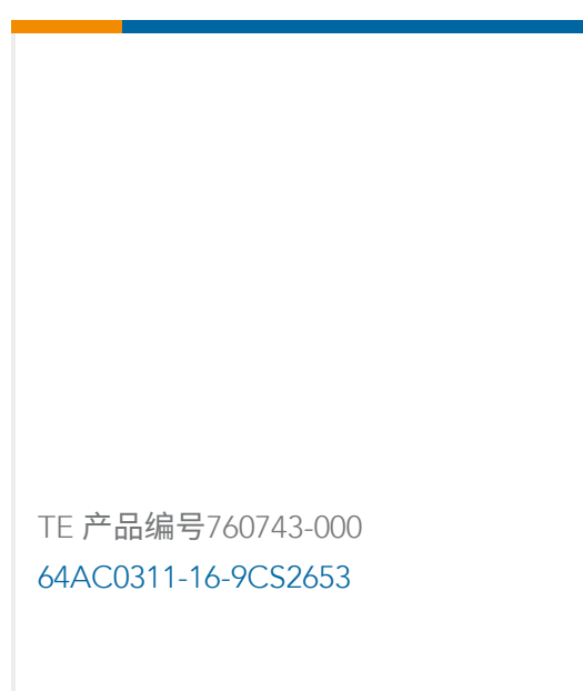
TE 产品编号760743-000 64AC0311-16-9CS2653