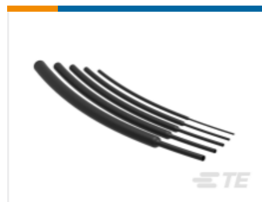
TE 产品编号E05774-000 VERSAFIT-1/4-0-25MM