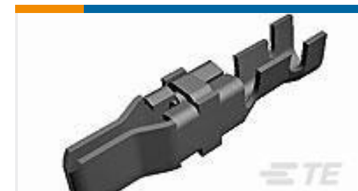
TE 产品编号66262-2 MALE CONTACT ASSY. (L.P.)