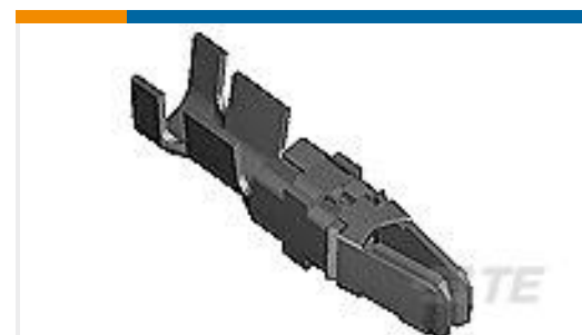
TE 产品编号66740-6 TYPE XII FEMALE CONT (L.P.)