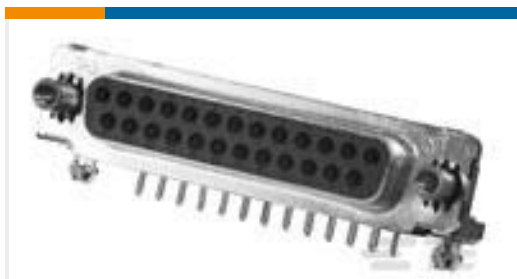
TE 产品编号5745781-2 09 MSFL RCPT RA 318 (FM)