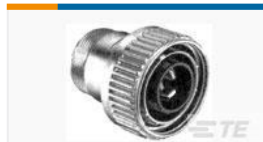
TE 产品编号208496-1 CMC PLUG ASSEMBLY,SZ 22