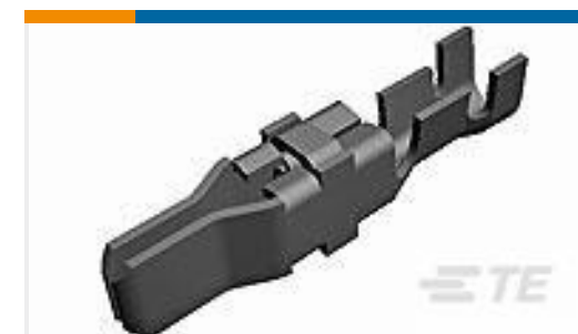
TE 产品编号66255-8 MALE CONTACT ASSY. (STRIP)