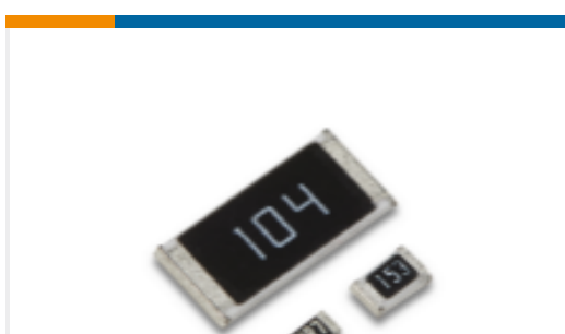
TE 产品编号5-2176339-0 CRGCQ 0603 120K 1%