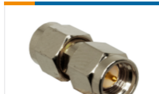
TE 产品编号ADP-SMAM-SMAM SMA Plug to SMA Plug