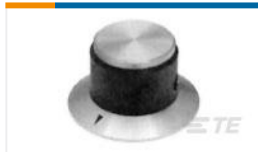
TE 产品编号7-1437622-6 KNS501BA1/4=KNOB BLK/ALUM W /SK