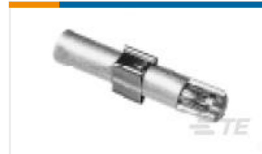
TE 产品编号193990-2 SKT ASSY,TYPE XII, #8 AWG