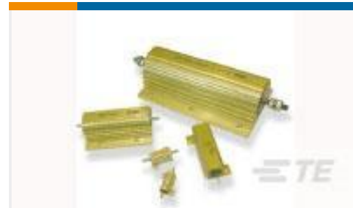
TE 产品编号7-1625999-7 HSC100 R18 5%