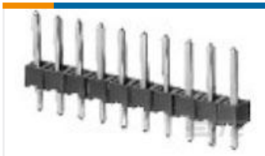
TE 产品编号5-146280-1 01 MODII HDR SRST B/A LF