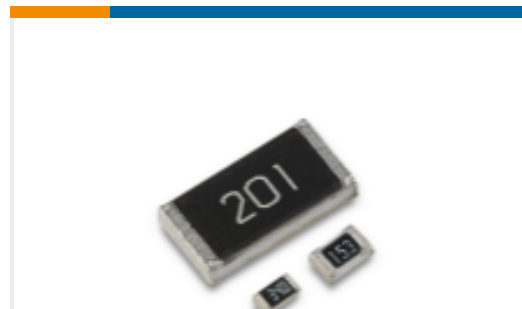
TE 产品编号3-2176329-1 CRGP 1210 3K3 1%