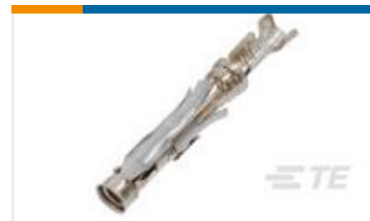
TE 产品编号2-66104-9 III+ SKT,24-20,TIN,STRIP