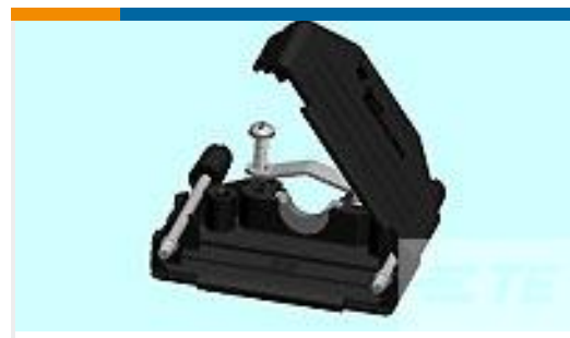
TE 产品编号2-1991253-5 25 WAY LOW COST D SUB BACKSHEL