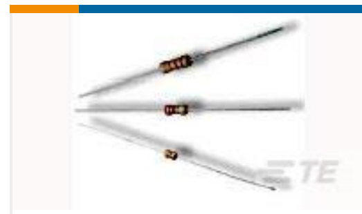
TE 产品编号3-1623933-0 CFR50 5% 470R