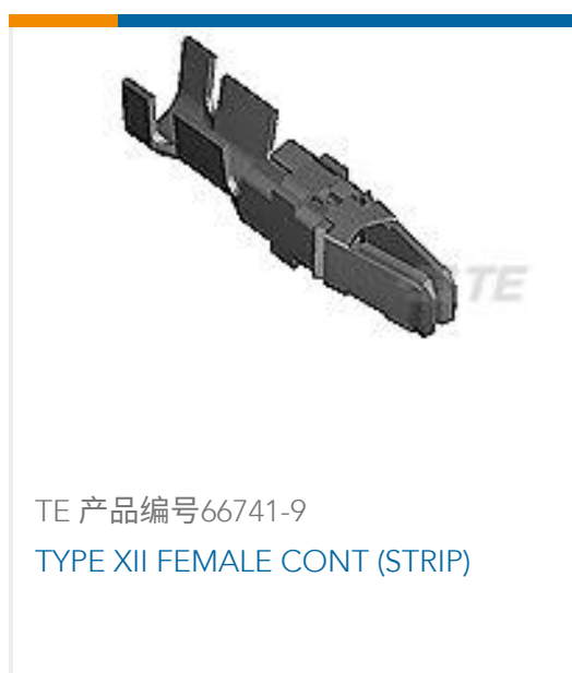
TE 产品编号66741-9 TYPE XII FEMALE CONT (STRIP)