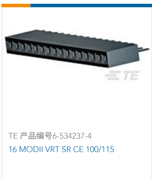
TE 产品编号6-534237-4 16 MODII VRT SR CE 100/115