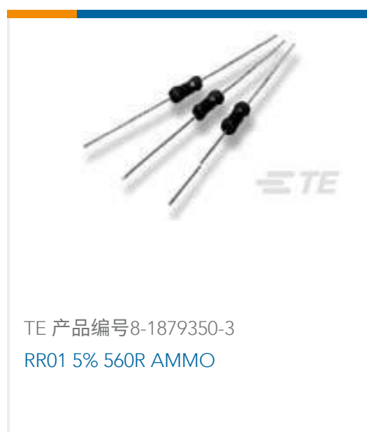
TE 产品编号8-1879350-3 RR01 5% 560R AMMO