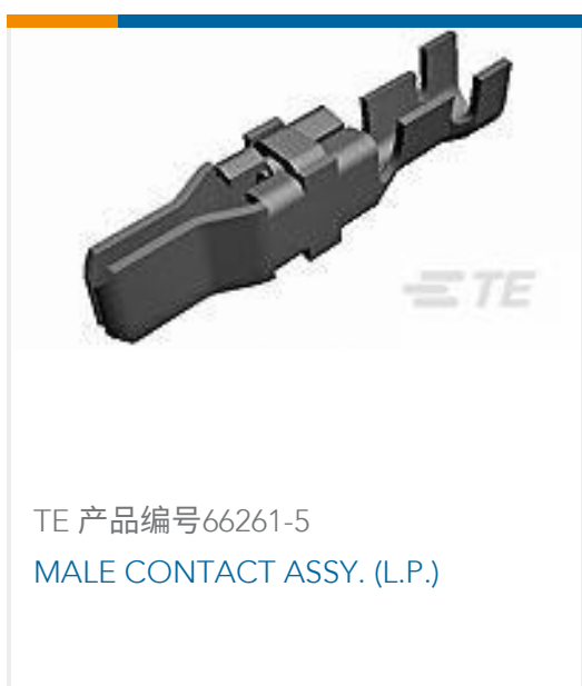
TE 产品编号66261-5 MALE CONTACT ASSY. (L.P.)