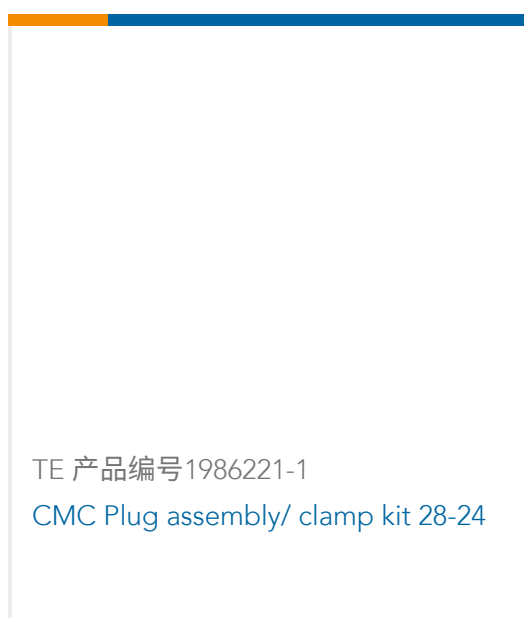
TE 产品编号1986221-1 CMC Plug assembly/ clamp kit 28-24