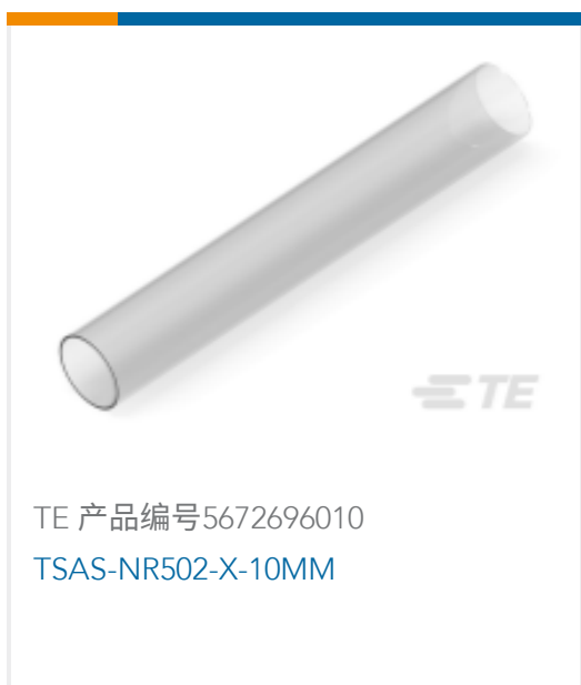
TE 产品编号5672696010 TSAS-NR502-X-10MM