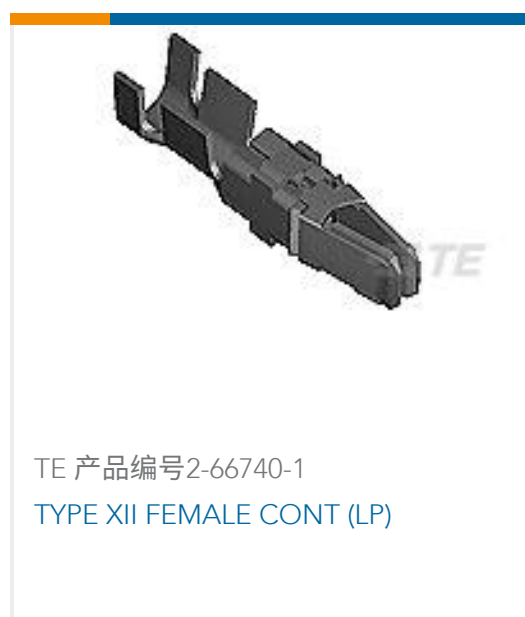
TE 产品编号2-66740-1 TYPE XII FEMALE CONT (LP)