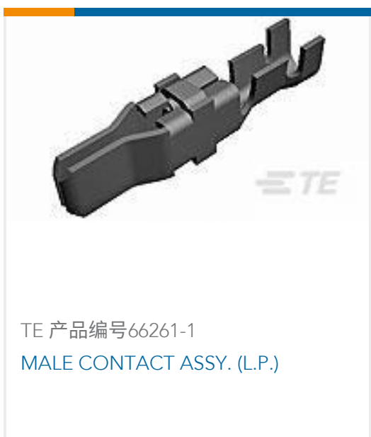
TE 产品编号66261-1 MALE CONTACT ASSY. (L.P.)