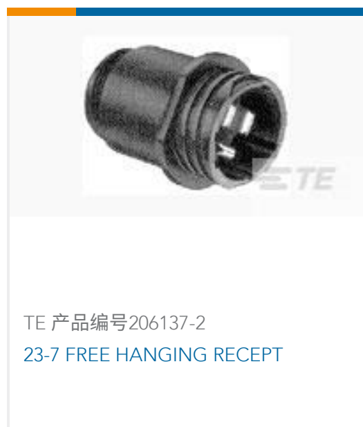
TE 产品编号206137-2 23-7 FREE HANGING RECEPT