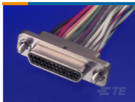
TE 产品编号1532214-2 M83513/01-FC, MCKS-C2-B-37PS