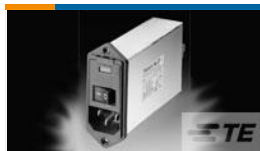
TE 产品编号3-1609109-0 PMOS0SZ6C=C7078