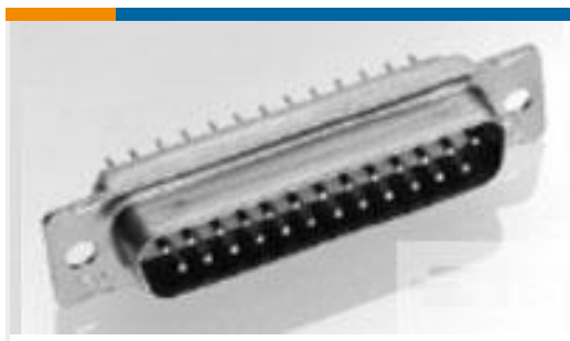
TE 产品编号206065-4 RECEPT ASSY,104 POSN,AMPLIMITE