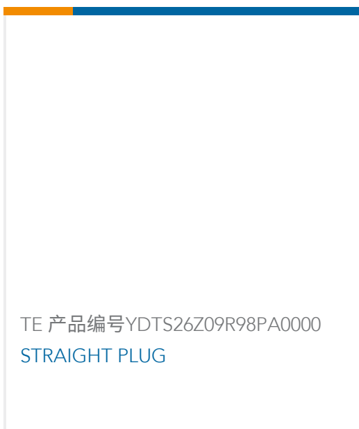
TE 产品编号YDTS26Z09R98PA0000 STRAIGHT PLUG