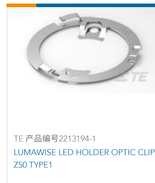
TE 产品编号2213194-1 LUMAWISE LED HOLDER OPTIC CLIP Z50 TYPE1