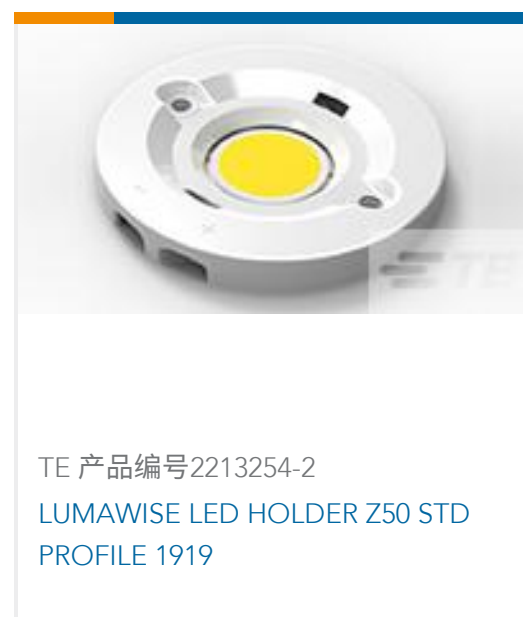
TE 产品编号2213254-2 LUMAWISE LED HOLDER Z50 STD PROFILE 1919