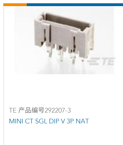
TE 产品编号292207-3 MINI CT SGL DIP V 3P NAT