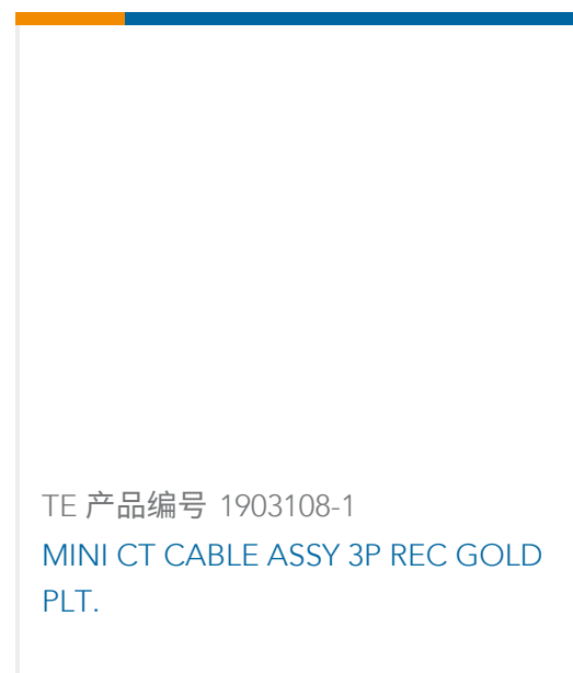
TE 产品编号 1903108-1 MINI CT CABLE ASSY 3P REC GOLD PLT.