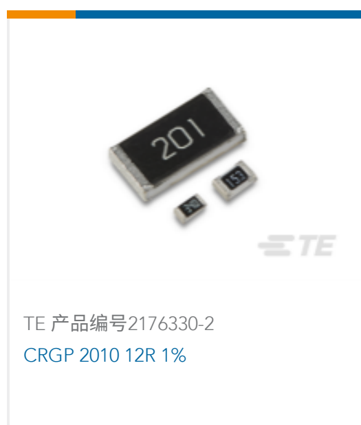
TE 产品编号2176330-2 CRGP 2010 12R 1%