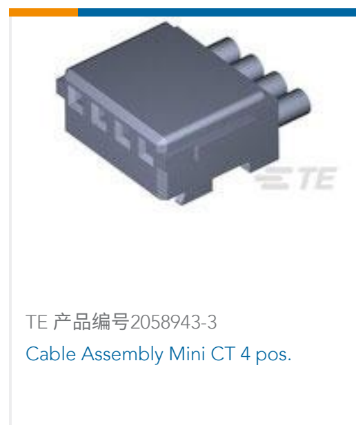
TE 产品编号2058943-3 Cable Assembly Mini CT 4 pos.