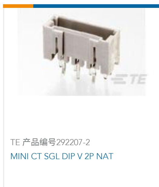
TE 产品编号292207-2 MINI CT SGL DIP V 2P NAT