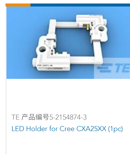
TE 产品编号5-2154874-3 LED Holder for Cree CXA25XX (1pc)