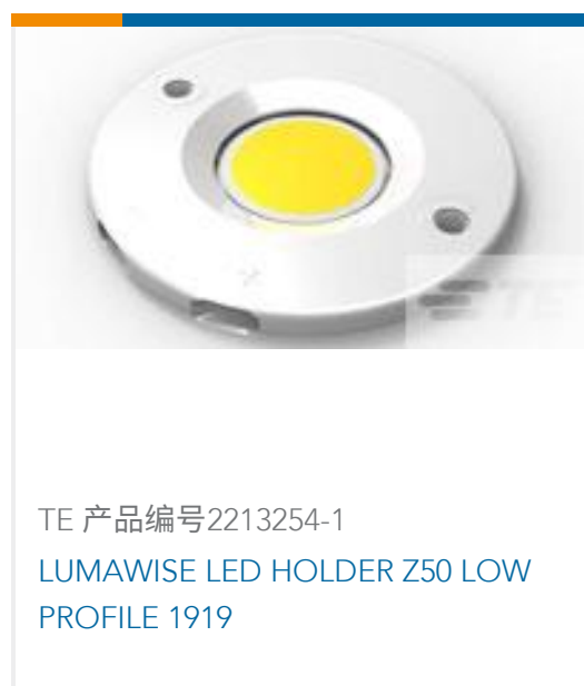
TE 产品编号2213254-1 LUMAWISE LED HOLDER Z50 LOW PROFILE 1919