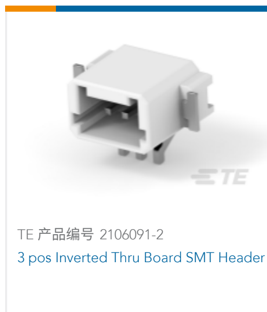
TE 产品编号 2106091-2 3 pos Inverted Thru Board SMT Header