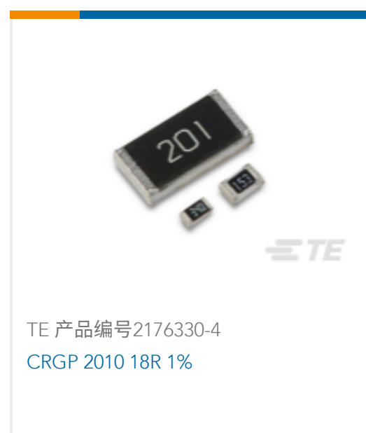
TE 产品编号2176330-4 CRGP 2010 18R 1%