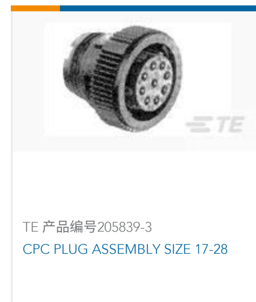
TE 产品编号205839-3 CPC PLUG ASSEMBLY SIZE 17-28