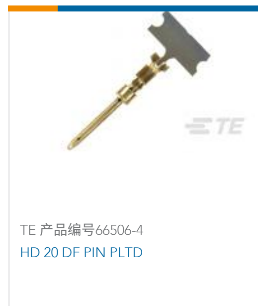
TE 产品编号66506-4 HD 20 DF PIN PLTD