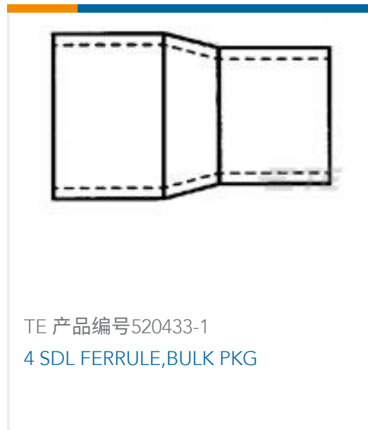
TE 产品编号520433-1 4 SDL FERRULE, BULK PKG