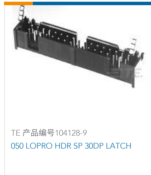
TE 产品编号104128-9 050 LOPRO HDR SP 30DP LATCH