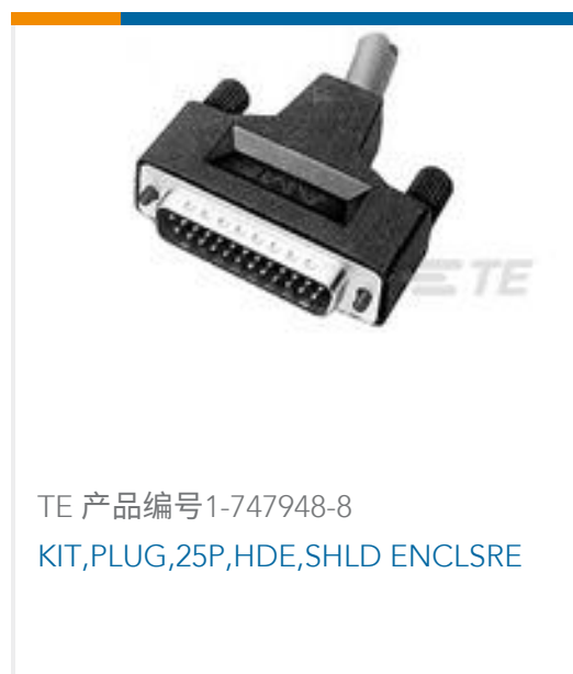
TE 产品编号1-747948-8 KIT, PLUG, 25P, HDE, SHLD ENCLSR