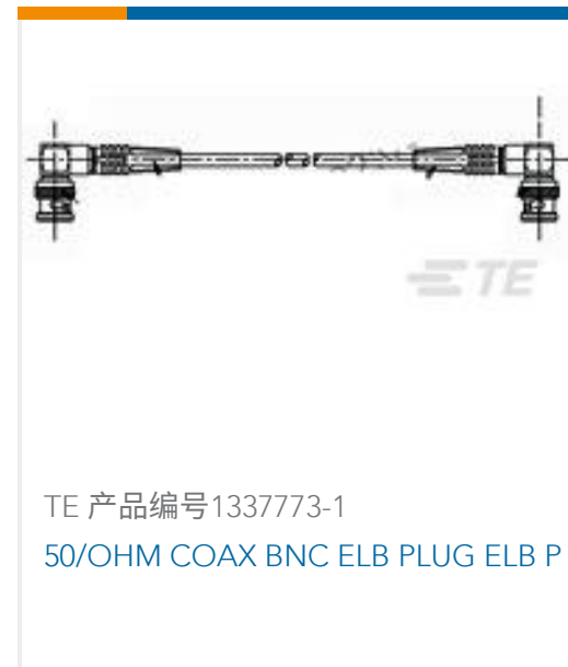
TE 产品编号1337773-1 50/OHM COAX BNC ELB PLUG ELB P