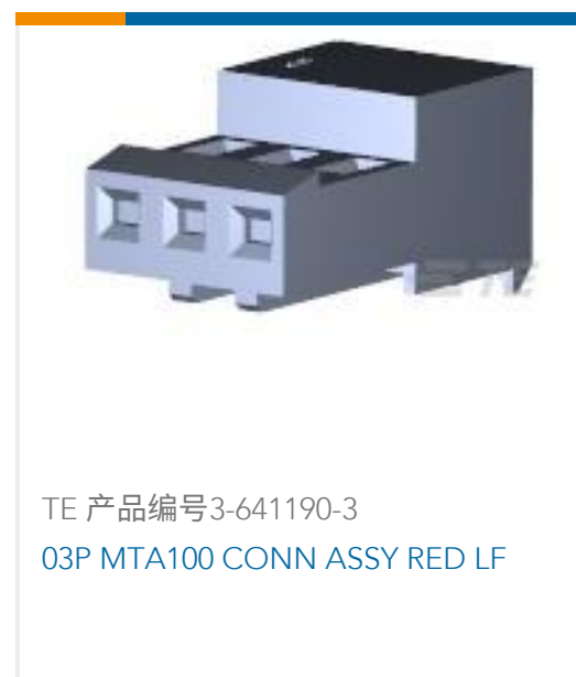
TE 产品编号3-641190-3 03P MTA100 CONN ASSY RED LF